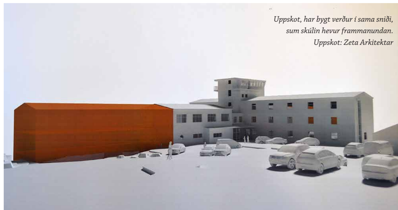
Uppskot, har bygt verður í sama sniði, sum skúlin hefur frammanundan. Uppskot: Zeta Arkitektar