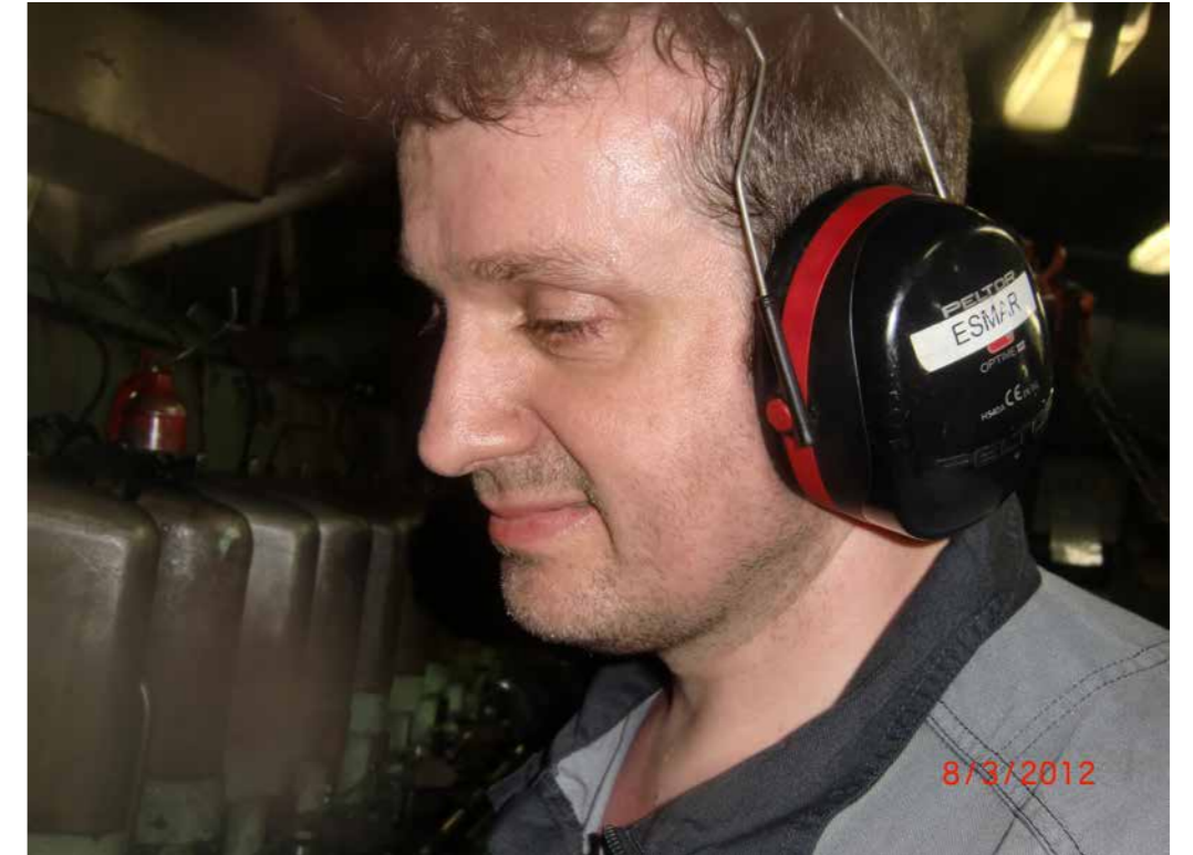
Her er Esmar í essinum – til arbeiðis í maskinrúminum.

– Ja, ja, tey vildu sleppa at sita hjá mær, flennir hann.