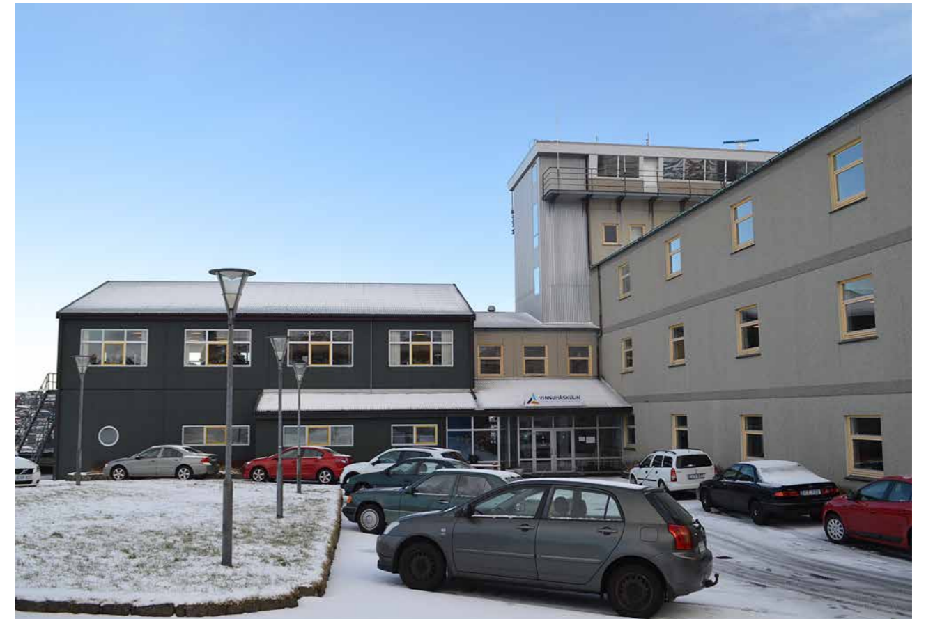
Vinnuháskúlin avmyndaður úr Nóatúni. Verður útbygt, so verður eisini bött munandi um parkeringsviðurskiptini.

meistarar og navigatørar fáa frálæru í somu lærugreinum, tað kann til dømis vera stóddfrøði, búskapur og leiðsla. Samlesturin kann gagnnýttast betur, um allir næmingar eru á sama stað. Stjórin heldur eisini, at tað gevur skúlanum nakað eyka, at hann verður størri, altso fleiri næmingar – skúlin fær tá eina størri „volumu“.