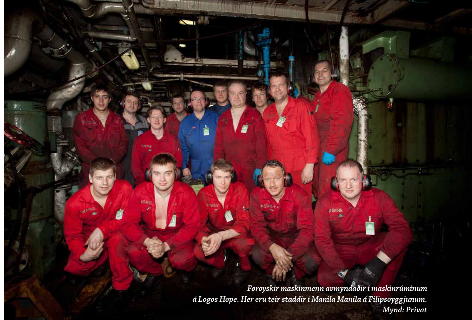
Føroyskir maskinmenn avmyndaðir í maskinrúminum á Logos Hope. Her eru teir staddir í Manila Manila á Filipsoyggjunum.

– Konan var við uppá at fara umborð á Logos Hope, reiðarið