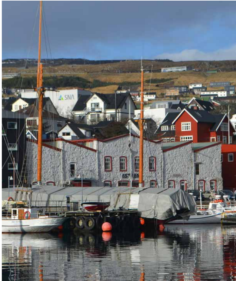
Aðalfundurinn verður hildin í Østrøm 24. mars.