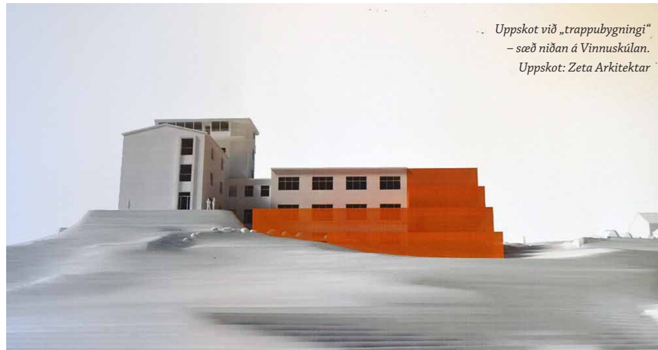
Uppskot við „trappubyggingi“ – sæð niðan á Vinnuskúlan. Uppskot: Zeta Arkitektar