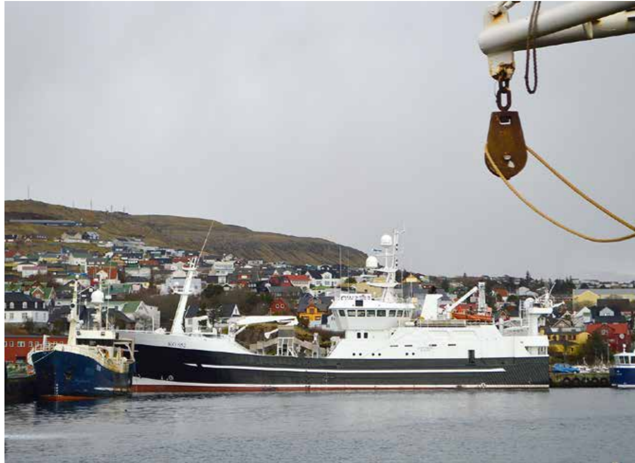
Nýggja aspirantskipanin gevur næmingunum møguleika at fáa siglingstíð sum part av sjálvari útbúgvingini

maskinmeistarar. Eftir loknan verkstaðsskúla og loknað starvsvenjing fara næmingarnir víðari á vanligu ástøðilligu útbúgvingina.