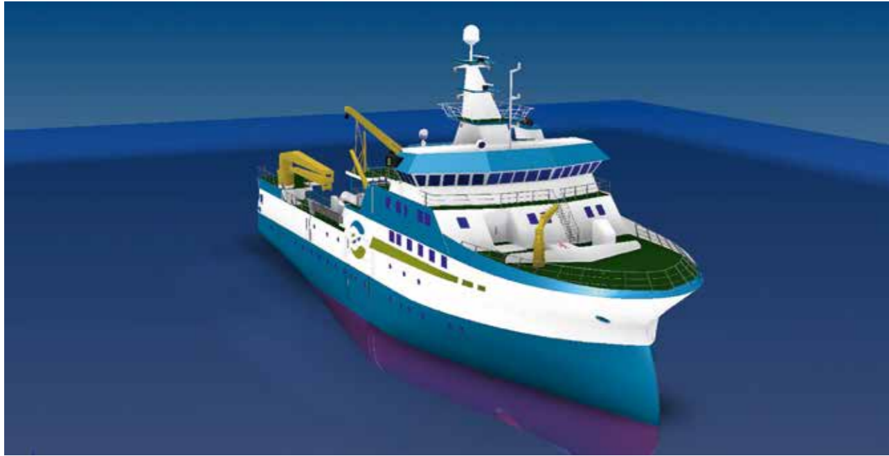
Nýggja havransóknarskipið hefur hesi mát: Longd, 54,4 m, breidd, 13,6 m, service ferð, 11 míl, mesta ferð, 14 míl, mesta manning, 25

av trumlum, spølum og aðrari útgerð, sigur Leon Smith.