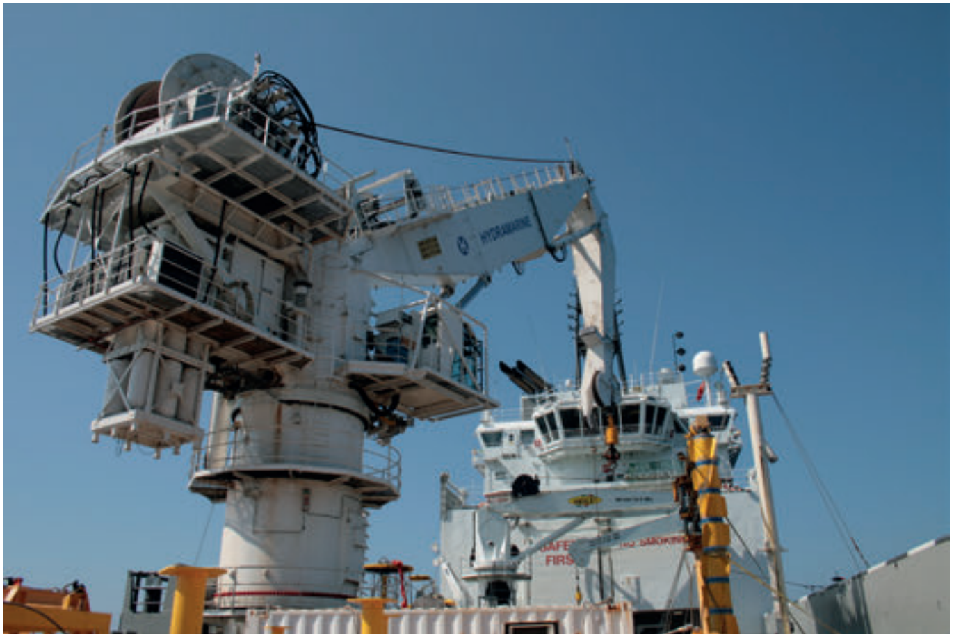
Umborð á Olympic Intervention