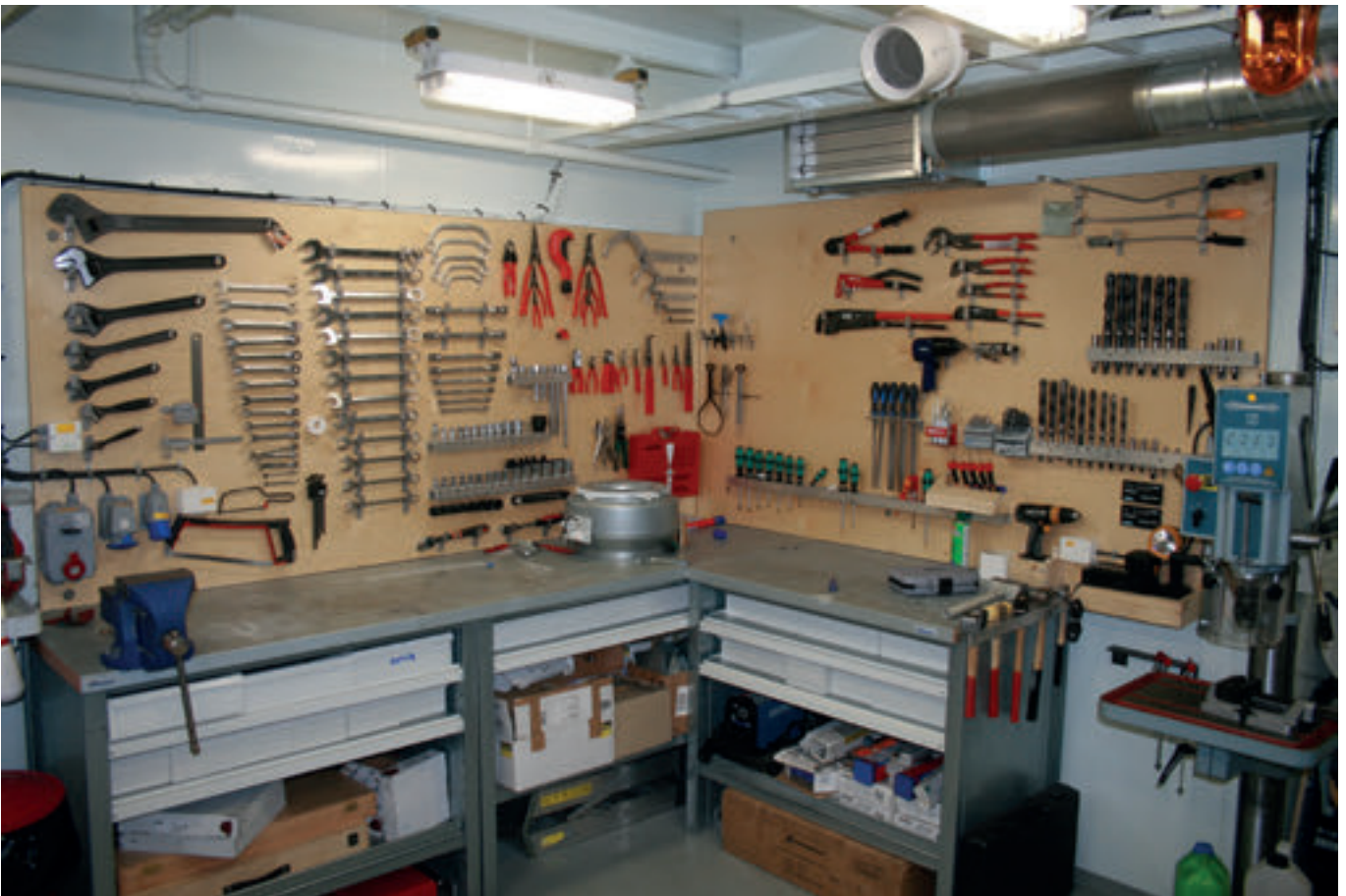
Verkstaðurin umborð á einum av skipunum, Petur Skeel Dahl, var við