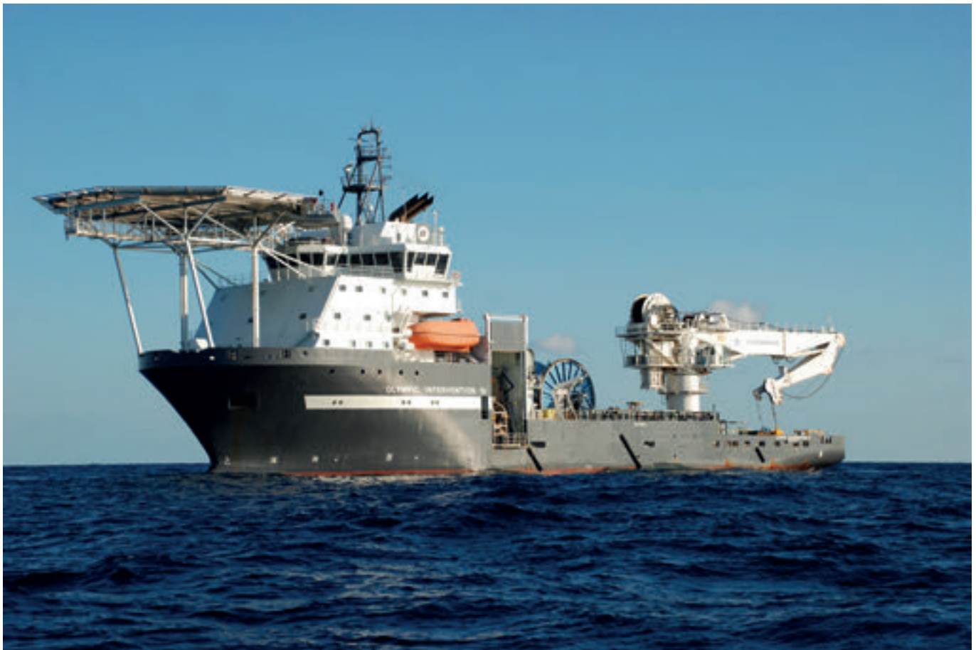
Petur sigldi í umleið átta ár við Olympic Intervention