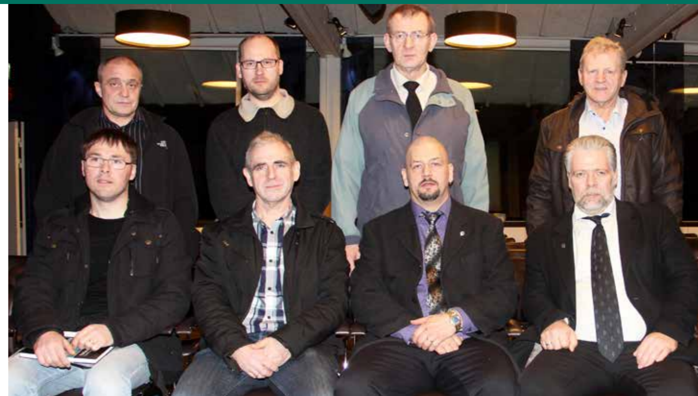
Nevndarlimir í Skipara- og Navigatørfelagnum á aðalfundi 28. Desember 2013:

Manningarfeløgini hava fund við manningarnar hjá Team Beredskab. Nýggja eftirlønarskipanin verður um-