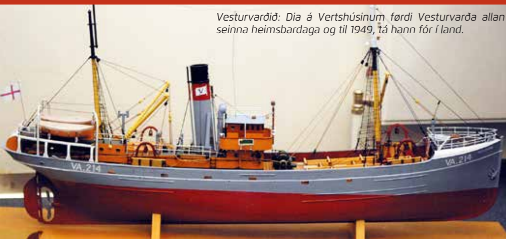
Vesturvarðið: Dia á Vertshúsinum færdi Vesturvarða allan seinna heimsbardaga og til 1949, tá hann fór í land.

Hetta hevði við sær, at menn góvust við ísfiskaveiðu, og so at siga allur trolaraflotin fór á saltfiskaveiðu. Og 1. ársfjórðing 1949 seldu føroysk skip fyri einans 3 mió. kr. í Bretlandi ímóti 8 mió. kr. fyrsta ársfjórðing 1948.