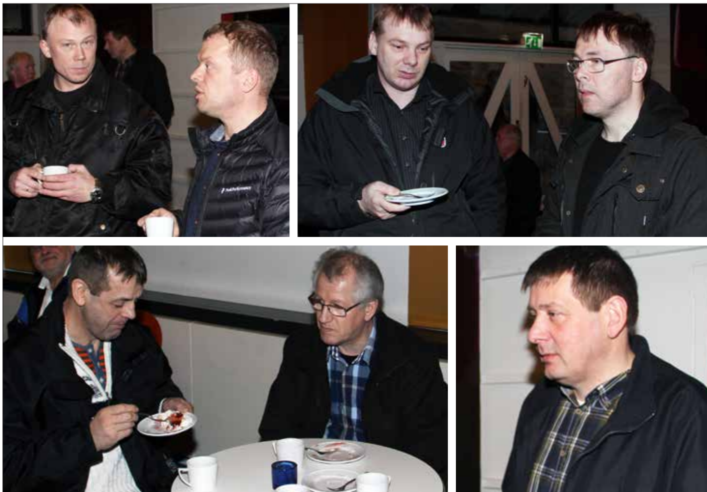
Fundarluttakarar á aðalfundinum.

minstiprísur ásetast. Tað kann ikki halda áfram, at landskassin skúmar róman, samstundis sum skipini mugu forera fiskin burtur.