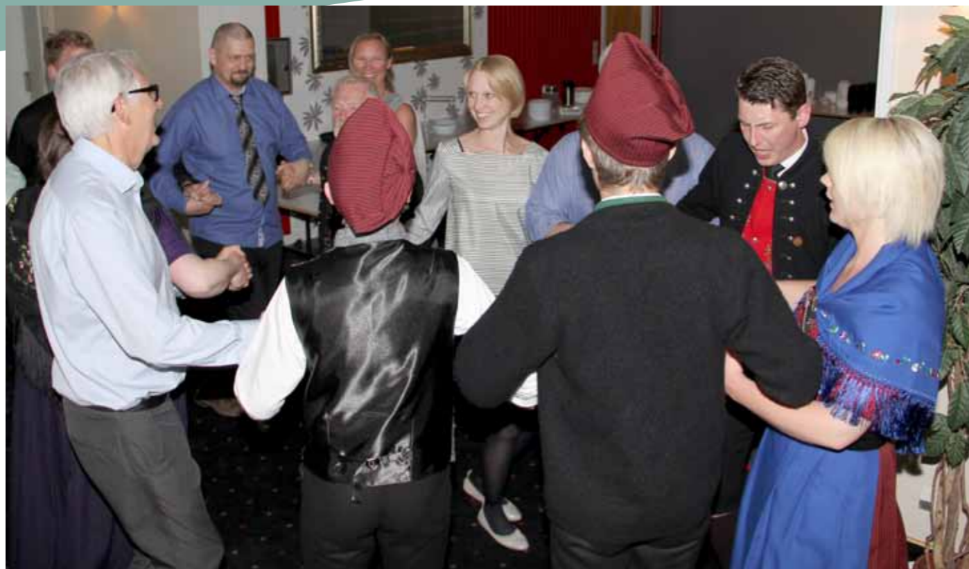
Gestirnir sluppu at roynd seg í feroyskum dansi.