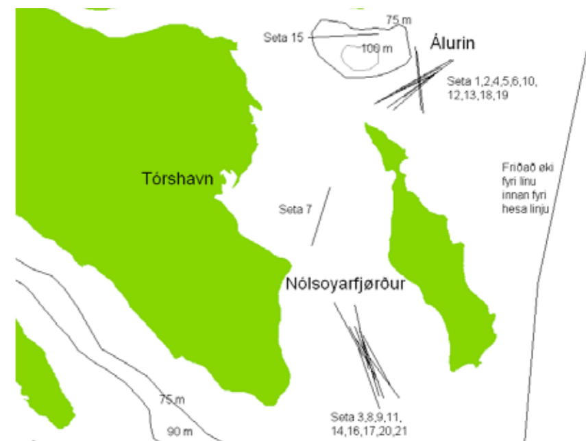
Tey bæði økini (Álurin og Nólsoyarfjørður), og hvar línurnar vórðu settar. Ein strika vísir til hvønn túr, har fýra línur (stampar) vórðu settar. Seta 7 hoyrði til Nólsoyarfjørð og seta 15 til Álin.