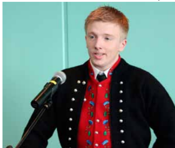
Næmingaumboð tóku eisini orðið