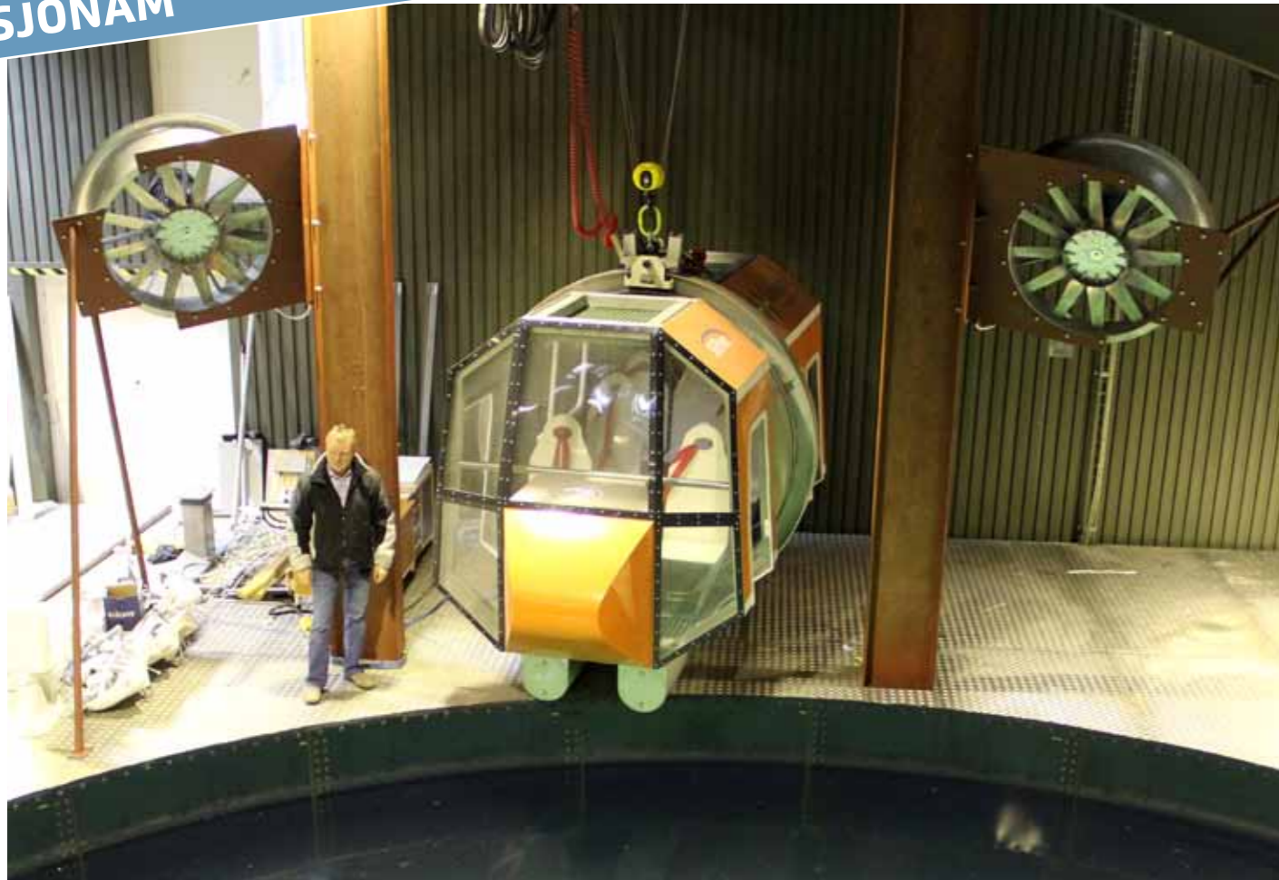
Sjónám hefur alla útgerð, sum krevst til at halda HUET-skeið; tað er venjing í bjarging úr søkkandi tyrlu. Á myndini eftirgjörda tyrlan, sum verður brúkt, tá skipað verður fyri HUET-skeiðum.

fyrí førleika til sjófólk (Standard of Training, Certification and Watchkeeping – STCW).