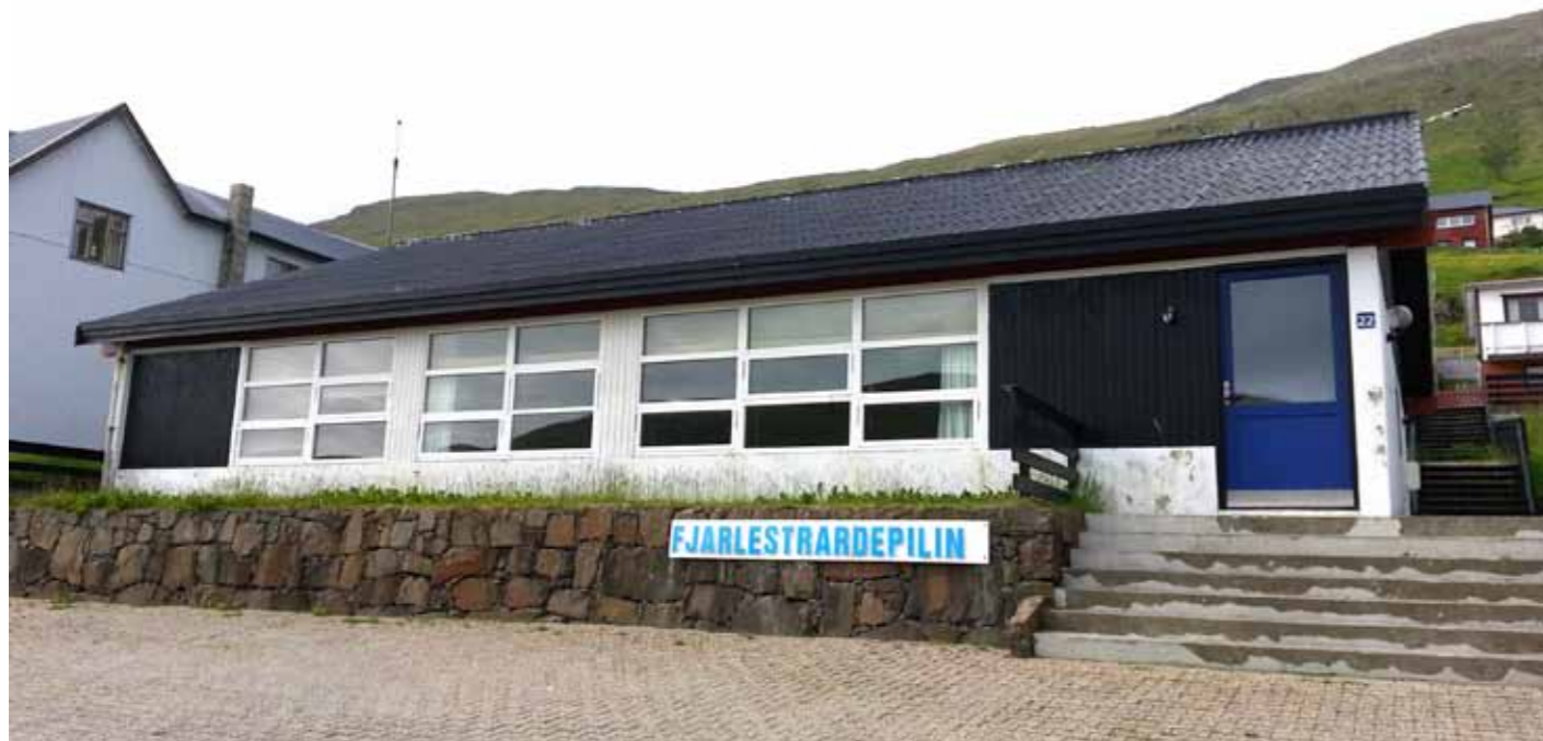
Fjarlestrardepilin hevur góðar umstøður í Vági.

tey, sum ætla undir hægri útbúgving ella undir eina hægri ískoytisútbúgving. Harumframt er Fjarlestrardepilin eisini eitt tilboð til tey, sum ætla undir endurútbúgving og uppskúling.