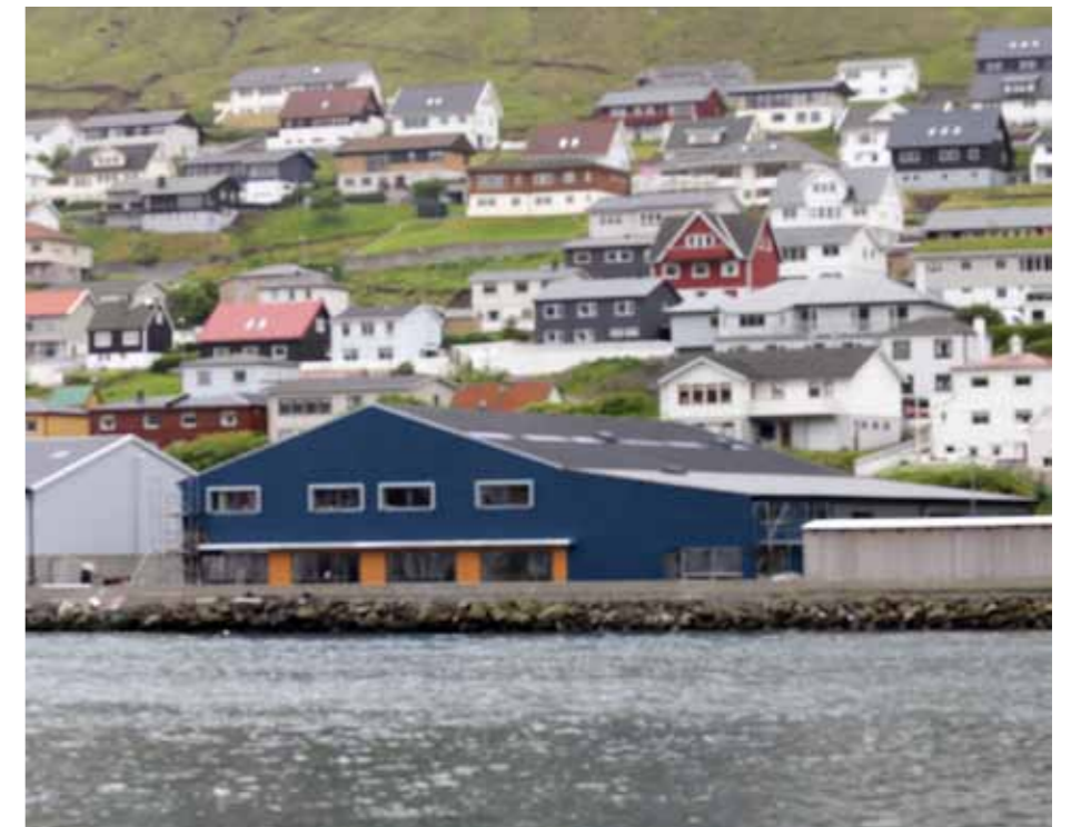
Sjónám er í stóra bláa bygninginum, sum er á Faktorsvegi 14 í Klaksvík.

Tað støðugt vaksandi talið av føroyingum við útlenskum skipum setur krøv. Tað sum liggur í stoypi-skeiðini í lötuni eru skeiðini í viðkaðari fyrstuhjálpi og sjúkuviðgerð. Ætlanin er, at hesi skeið verða partur av virkseminum í 2013.