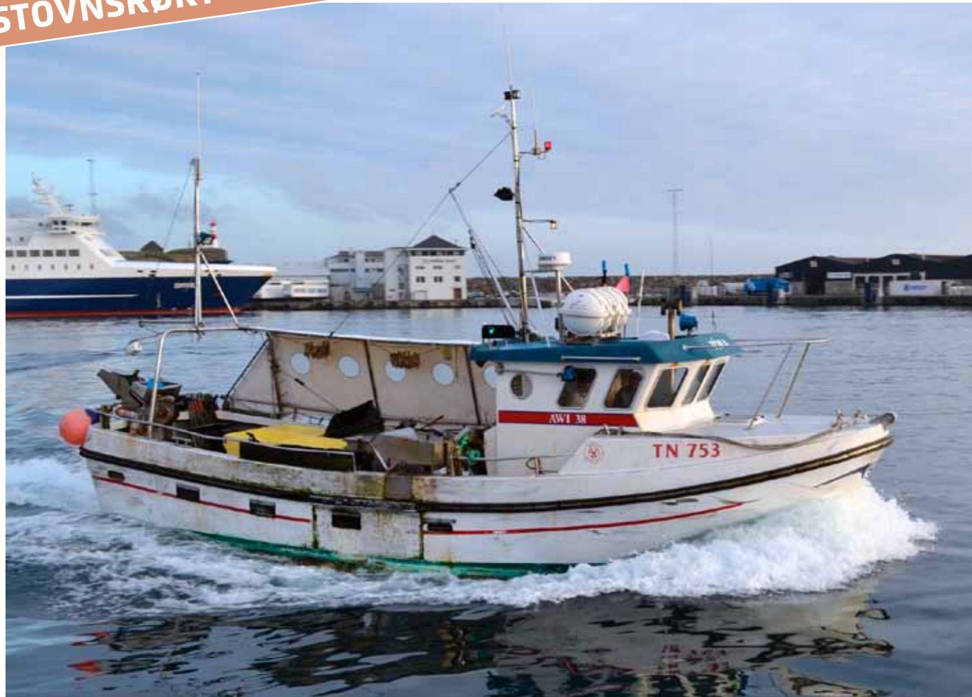
M/B Tóra, sum varð nýttur til agn-húkaroyndirnar.

Teir brúka eisini høggu-slökk og makrel, men lítið av sild.