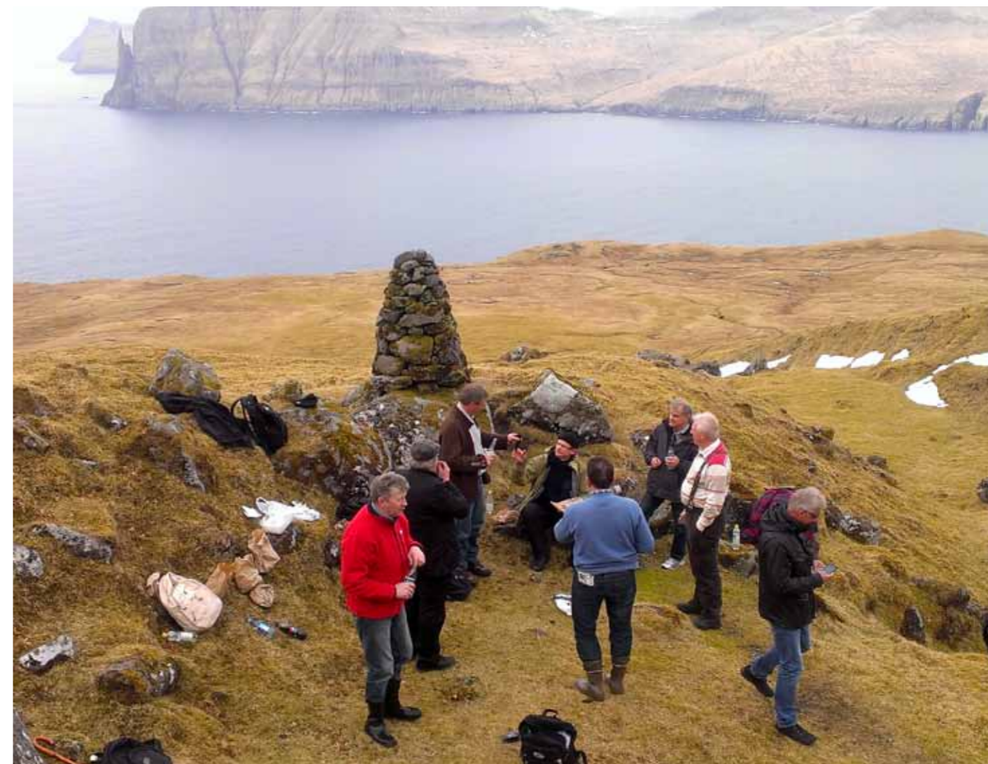
Skipað var fyri einum sera væl eydnaðum túri fyri Vestan.

2013. Semja var eisini um framtíðar málsetning fyri NMF. Tað vóru eisini stundir til ein túr fyri Vestan, saman við nøkrum av gestuum, vit vóru hepnir við veðrinum so túrurin eydnaðist væl.