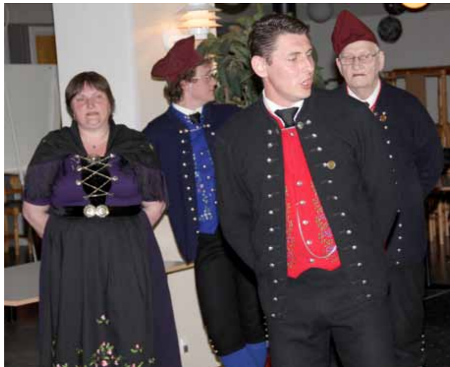
Umboð fyri Klaksvíkar dansifelag greiddi sera væl frá føroyskum dansi.

Endamálið við hesi kunning er, at so kunnu feløgini læra av royndunum hjá hvørjum øðrum.