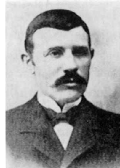
Tummas við Kráir

Eina stutta tíð lógu skipini í Jacobshavn, meðan teir róðu út við báti. Tá varð roynt eftir hellufiski, men av tí, at teir ikki fingur tunnur, noyddust teir at gevast. Í Grønlandi var veðrið gott alla tíðina.