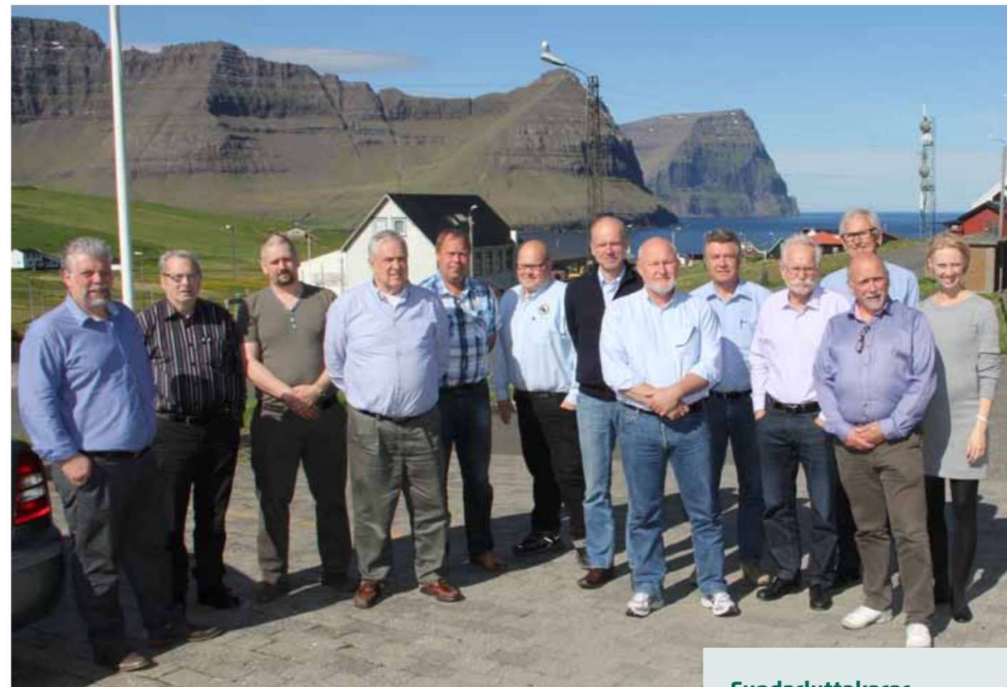
Fundarluttakarar í góðveðri á Viðareiði

Stuttur samandráttur úr tí sum kom fram: