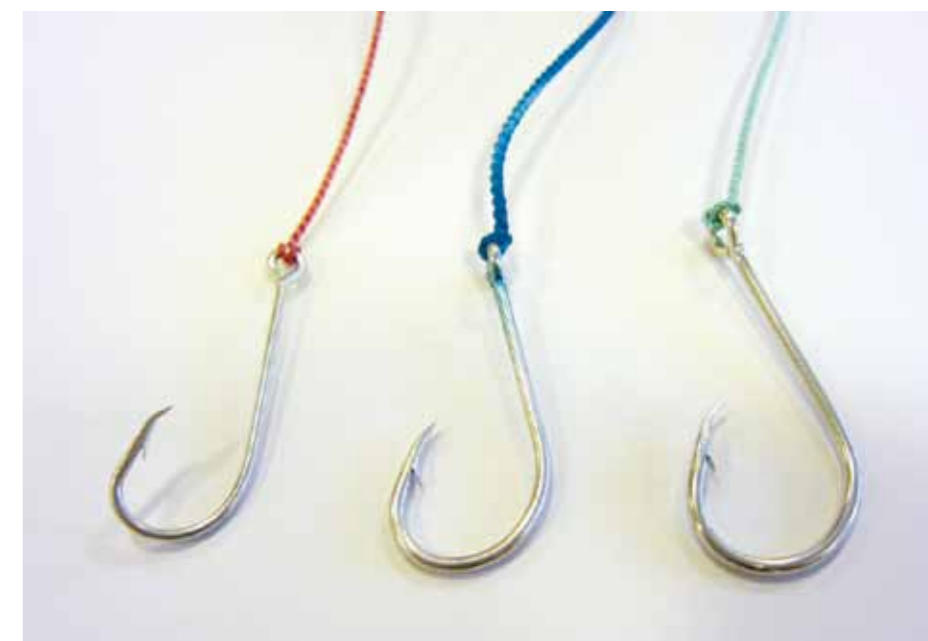
Húkastøddirnar, sum vórðu brúktar í agn-húkaroyndini. Frá vinstri: EZ 10, EZ 12 og EZ 13.

Teir báðir vísa á, at síðani 2006 hevur fiskiskapurin eftir toski og hýsu verið søguliga lítil.