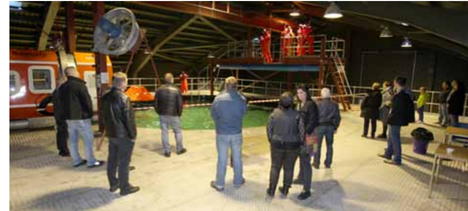
Nógv teknisk útgerð

Áðrenn hetta var neyðugt at fara uttanlands at taka HUET. Tá var vanligt, at skeiðluttakarinn mátti vera burtur í 3 dagar.