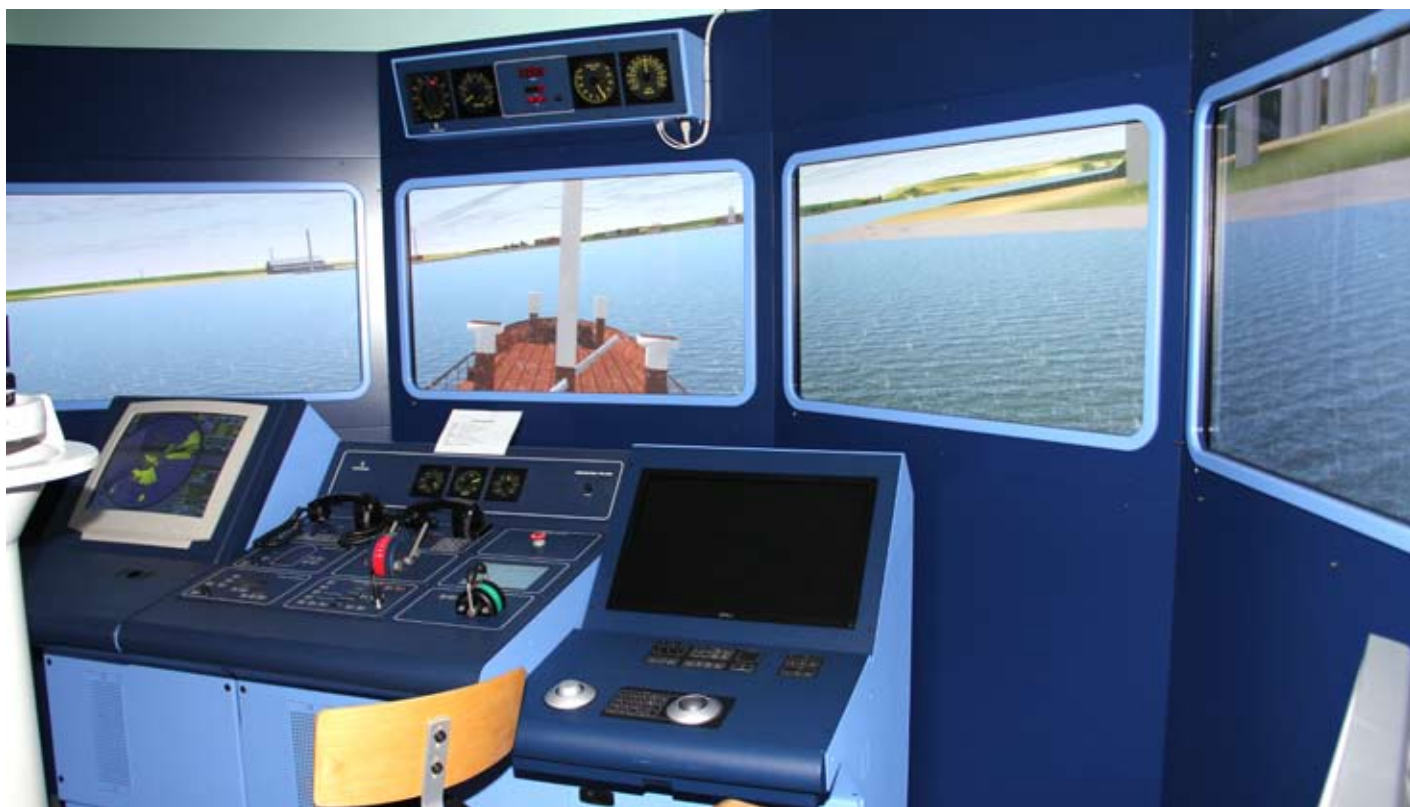
Nýggj nautisk útgerð á Vinnuháskúlanum