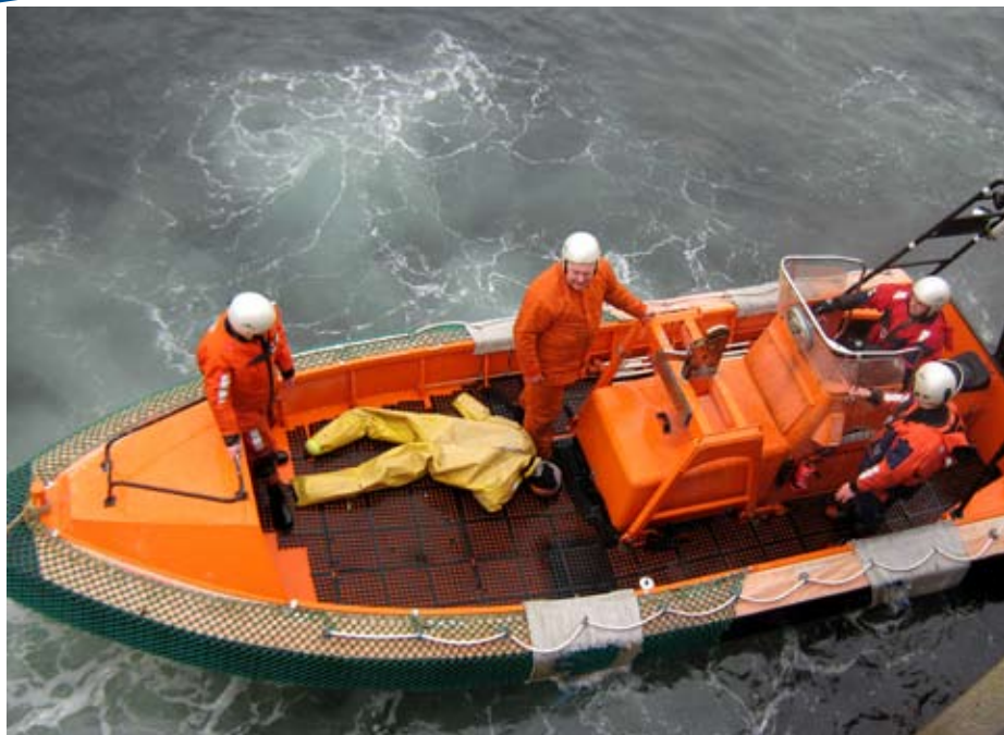
Sjóvenjingar við skjóttgangandi báti – MOB-báti – fara framhaldandi at verða gjørdar á sjónum á Borðoyavík.