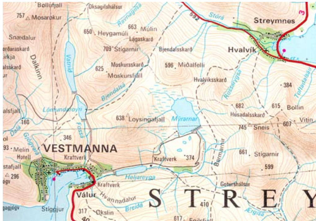
Orkukeldurnar í Vestmanna. Navnið Heygadalur og Heygadalssvatn vanta á kortinum – tað er áin, ið eitur Heljareyga.

mesta lagi ganga tvey ár og í minsta lagi eitt ár, áðrenn SEV kann taka endaliga støðu til verkætlanina hjá Røkt.