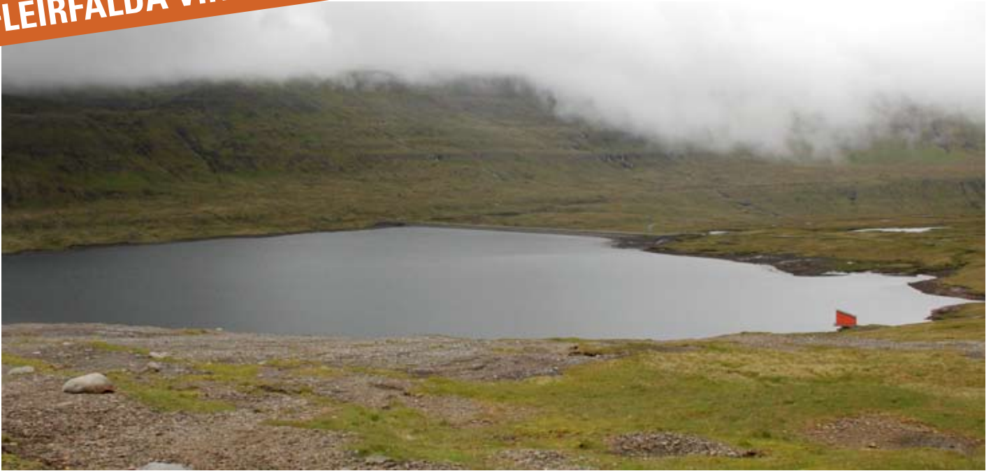
Mýravatn avmyndað frá vindmyllunum. Í nýggju verkætlanini skulu fleiri myllur setast upp her at framleiða til netið og at pumpa vatn frá Heygadalvatni og niðan í Mýravatn.

Nettoframleiðslan í nýggju verkætlanini hjá Røkt verður sostatt 32.8 milliónir kWh um árið.