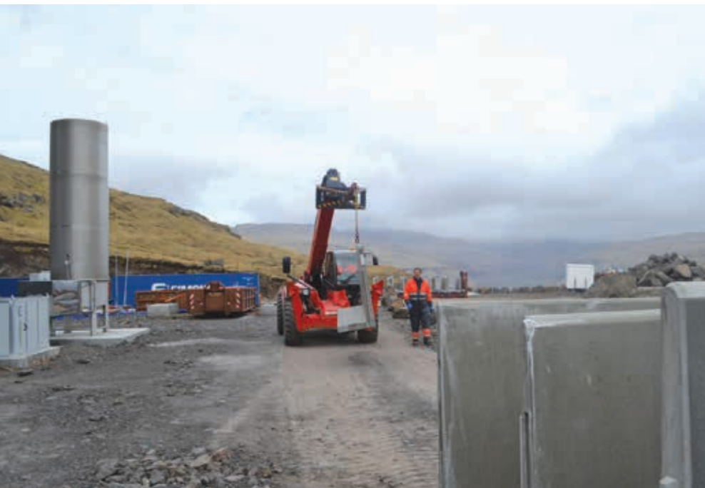
Norðast á plássinum stendur kyndilin, sum verður brúktur at avbrenna biogass, um framleiðslan verður størri, enn motorurin klárar at slúka

streym, og umleið 44 prosent verða til hita, og restin er tap – eitt nú tað sum fer upp gjøgnum skorsteinin.