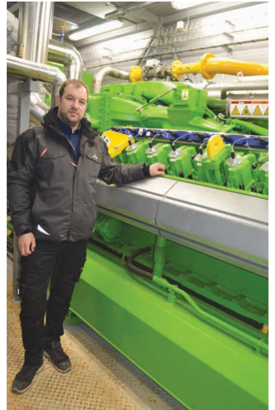
Motorurin er ein gassmotorur upp á 1500 kilowatt – og sjálvandi við tendriproppum

Fleiri sama slag anlegg sum tað á Sandvíkarhjalla standa aðrastaðni í Evropa. BIGA-Dan hevur sín fasta hátt at byggja biogass-anlegg. Sumt av útgerðini er monterað í bingjum, sum bara vera settar upp við pumpum ella aðrari útgerð í. Nógv útgerð er standard og verður ikki altíð