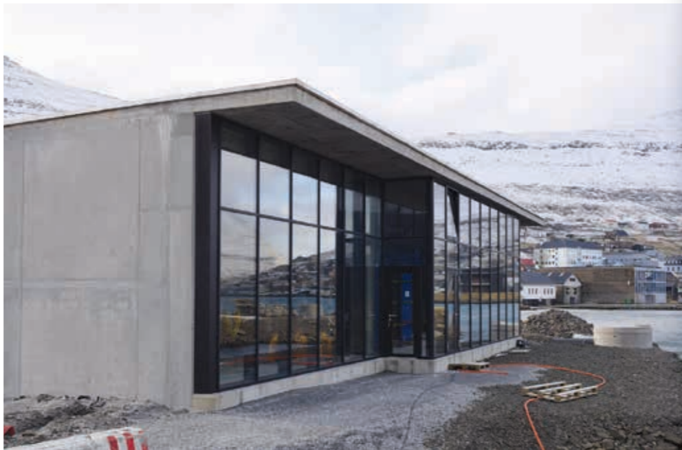
Sjóhitastøðin er ein snøggur bygningur við nógvum stórum vindeygum út móti sjónum – og móti Biskupstorginum

– Og so vóna vit sjálvandi, at tað fer at loysa seg fíggjarliga