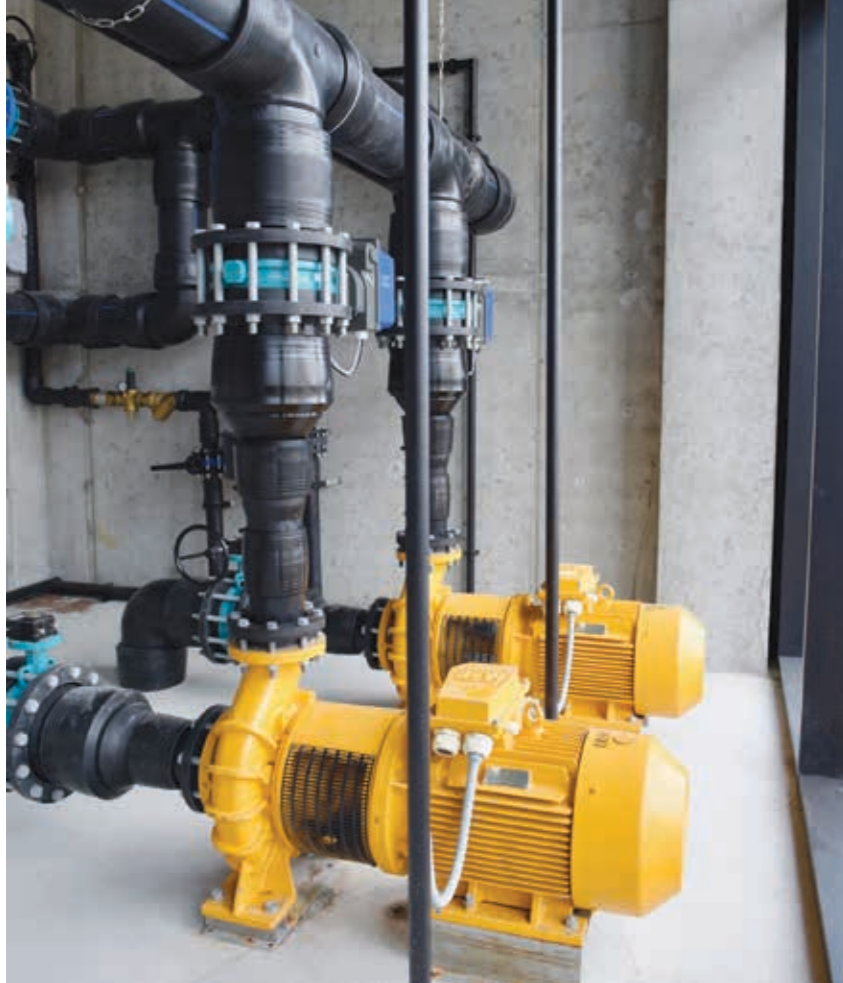
Gulu pumpurnar pumpa sjógv inn í skipanina

Skúlin við Skúlatrøð í dag bundin í sjóhitaskipanina. Skoytibreytin varð eisini tikin uppí, tá hon varð tikin í nýtslu í fjør.