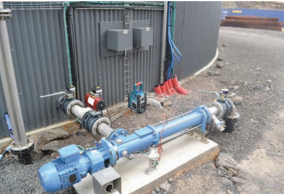
Pumpurnar vera allar drivnar við streymi, sum verkið sjálfvtt framleiðir