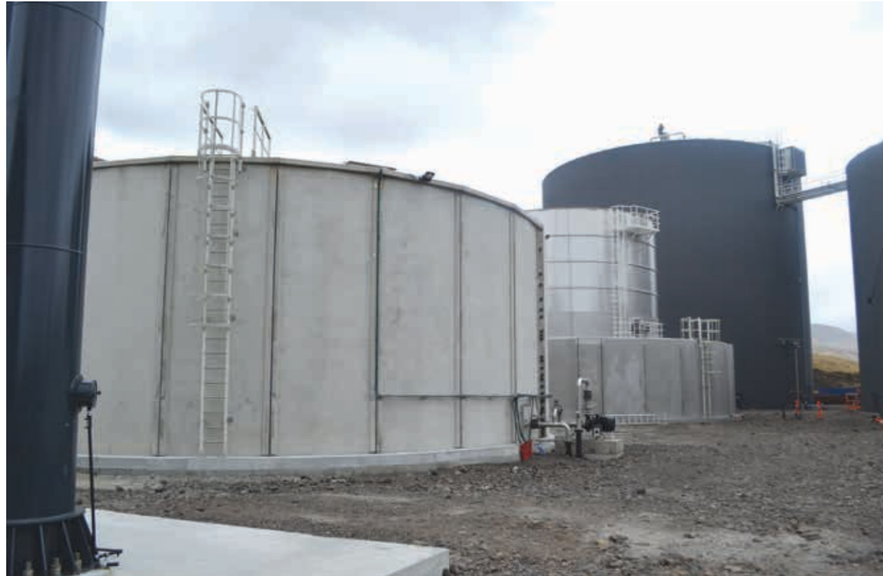
Stóri framleiðslutangin er 9000 kubikk. Frammanfyri stendur tangin til súrlög, sum av trygðarorsøkum stendur uppi í einum øðrum tanga