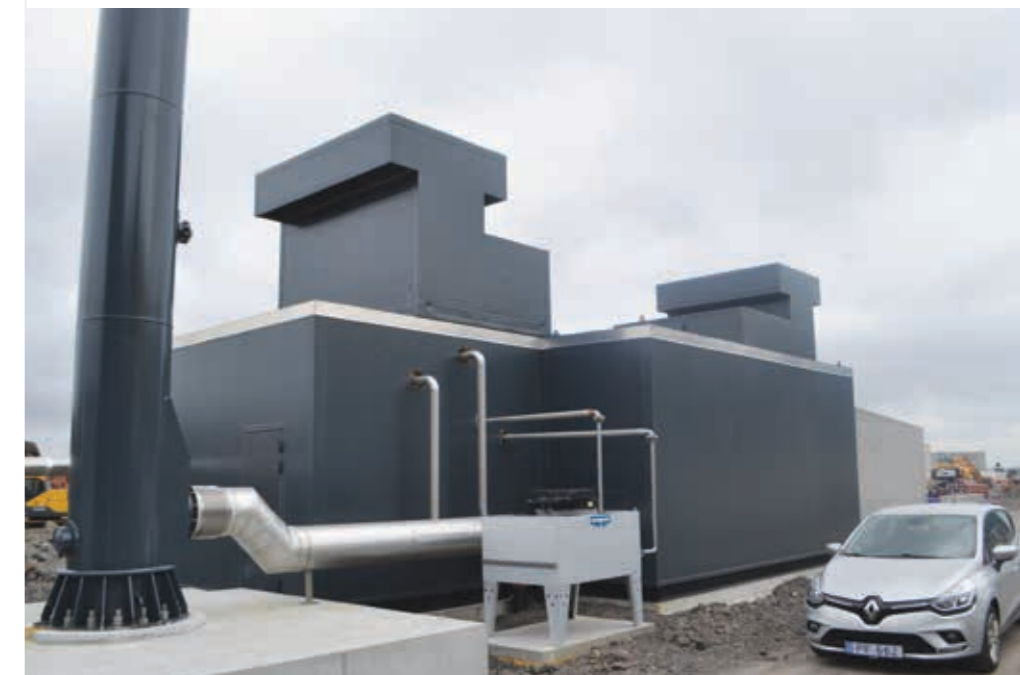
Motorurin – ein Jenbacher – stendur í húsunun mitt á verkinum