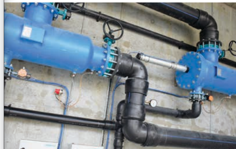
Hetta eru heilt serliga filtrini – við gráu stemplunum í endanum, sum filtrera sjógvin, so hann er reinur, tá hann kemur inn í skipanina