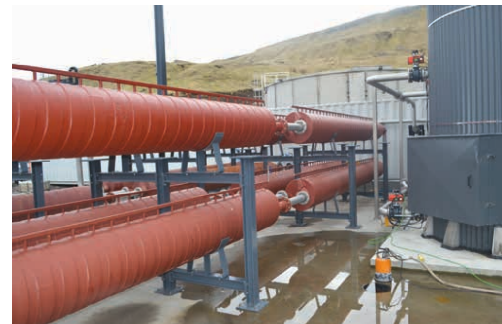
Allur biomassin verður hitaður upp um 85 stig í 25 minuttir og so køldur aftur til 42 stig, áðrenn hann verður pumpaður inn í stóra framleiðslutangan