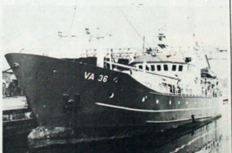
Heldarstindur – all manningin legd inn á sjúkrabús við brunasárum

Hetta er serliga farið fram í tí skínum, har teir Sameindu góvu Týskaranum boð um at kasta út