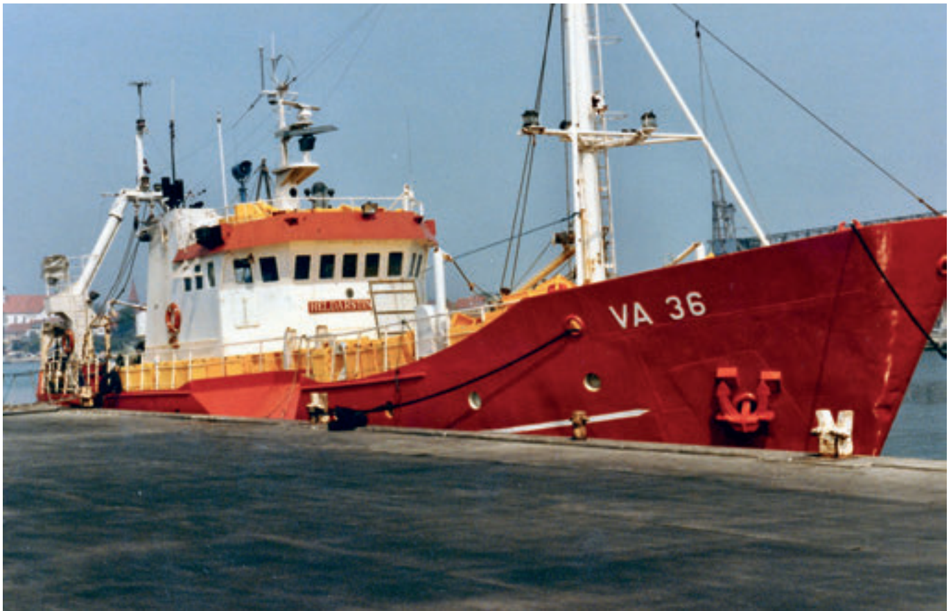
Hieldarstindur við bryggju á Bornholm