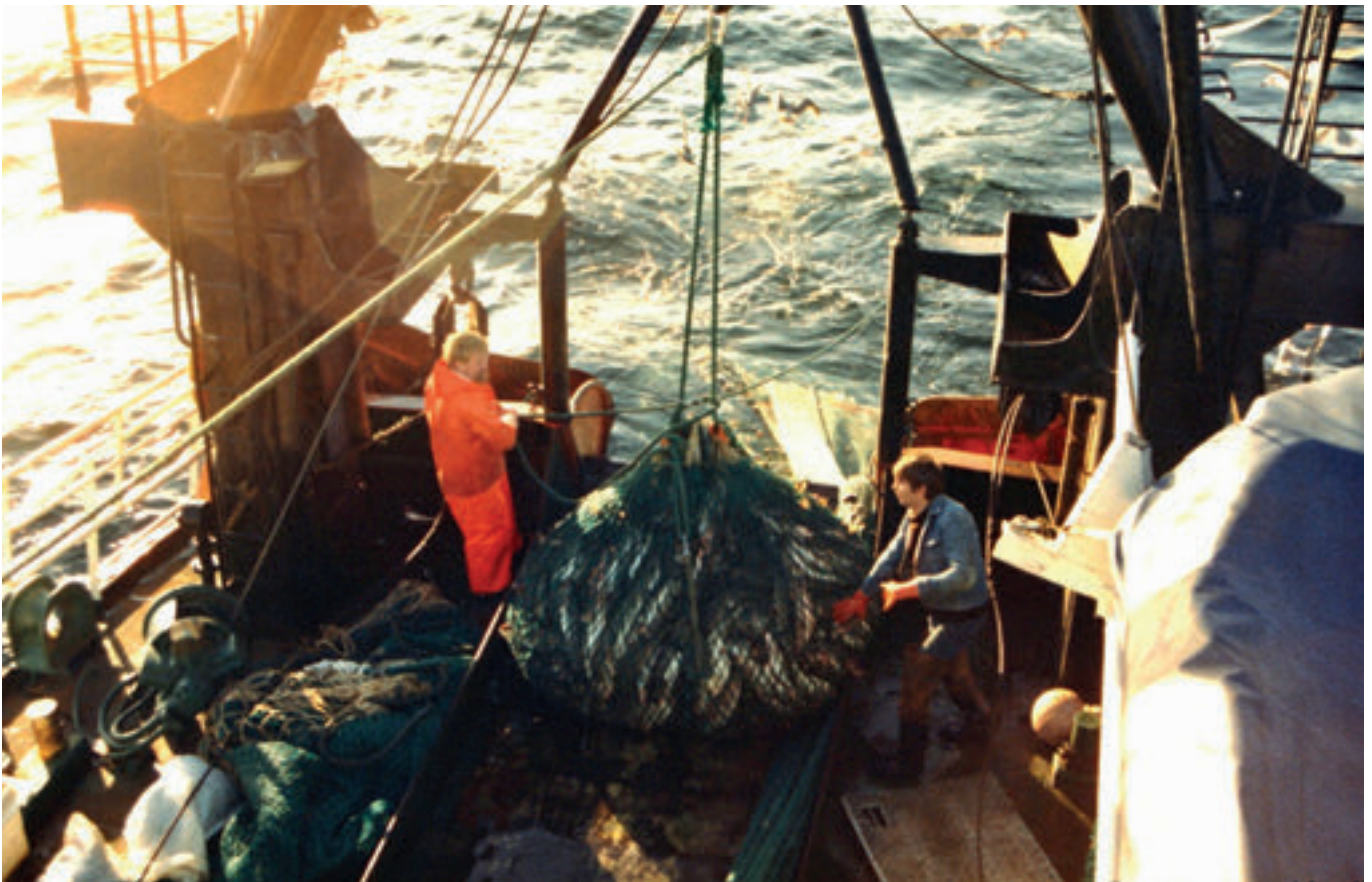
Trolposin er júst komin inn á dekkið á Heldarstindi