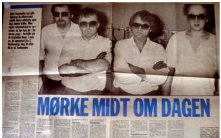
Miðsíðurnar í danskari avís

mundið givin heilivágur fyri brunasár, meðan tey í Hvidovre nýta vatn og skoling.