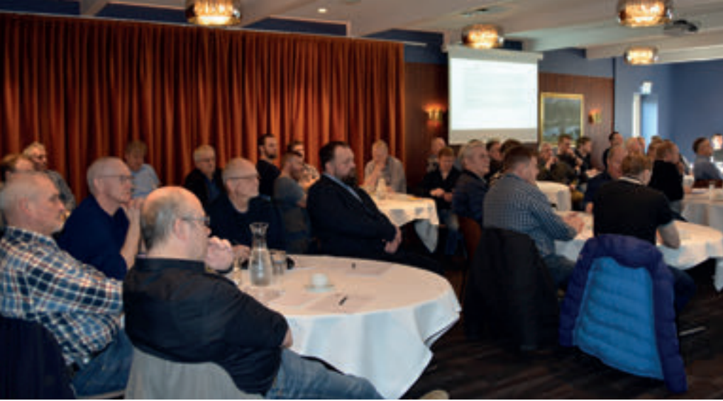
Uppmøtingin var góð á aðalfundinum í ár, eftir at teir tveir undanfarnu aðalfundirnir vóru nógv avmarkaðir og turrgeildir fyri hugna og sosiala samveru orsakað av koronu