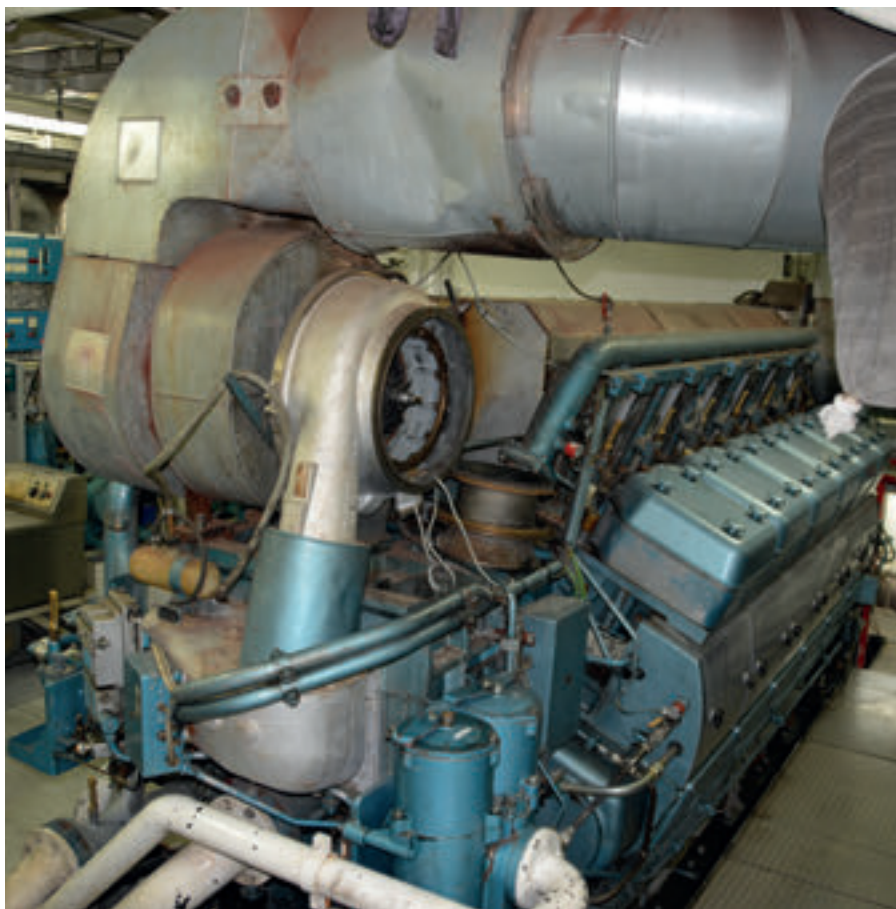
Herjólfur III hevur tveir Alpha-MAN-motorar, og teir eru, eins og alt annað umborð, stak væl hildnir

SSL hevur fyribils leigað Herjólf III til út á heystið næsta ár at bota um ferðasambandið, serliga farmaflutningin, til og úr Suðuroy. Tá dokkingin á Skála er av, fer Herjólfur III tiskil at røkja suðuroyarsiglingina saman við Smyrli, til hann skal í dokk fimm-seks vikur um hálván august. Tað tíðarskeiðið verður Herjólfur III einsamallur á suðuroyarleiðini, men aftaná fara bæði skipini aftur at røkja siglingina. Tó er avtala gjørd við íslenska eigarán, Vegagerðin, um, at skipið skal aftur til Íslands sum avloysaraskip í nakrar vikur í oktober í ár.