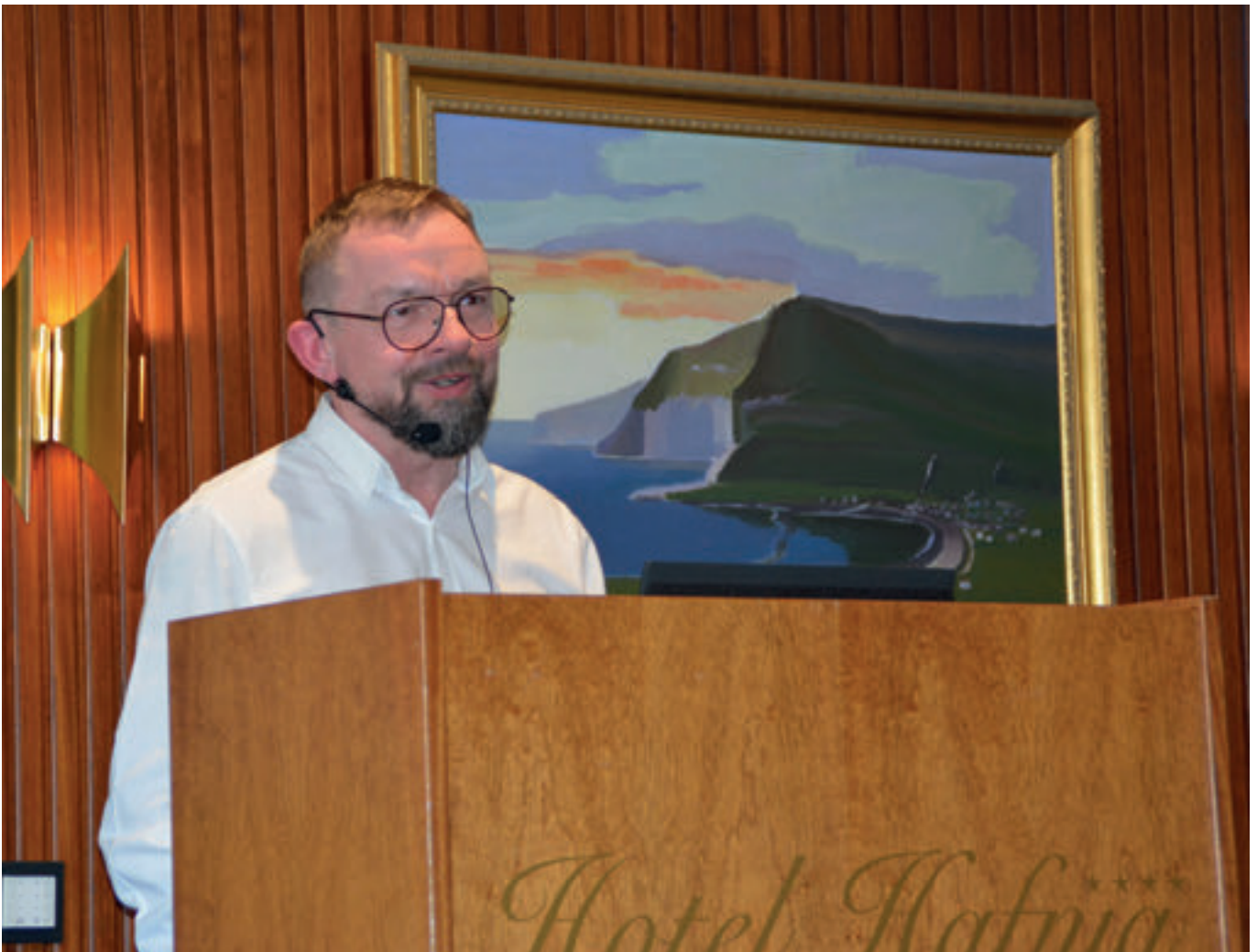
Formaðurin vísti eisini á frambrot og góða gongd á fleiri økjum. Hann fegnaðist millum annað um vaksandi handilsflotan, sum serliga reiðarið Navigare hevur æruna av, og um semjuna, sum tryggjaði mistu hýruna hjá føroysku manningunum, ið blivu uppsagdar, tá norska reiðarið Simon Møkster flaggaði aftur til Noregs