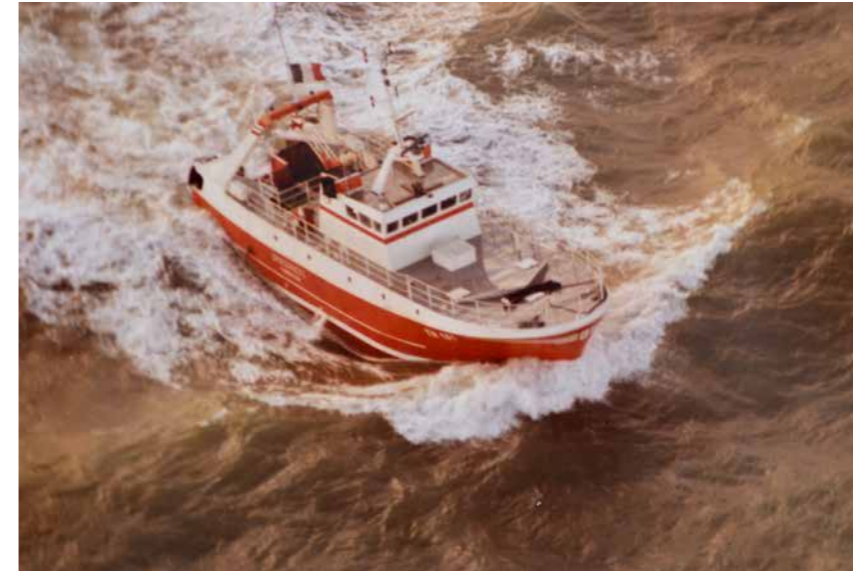
Í 1981 fór nýggi trolarin hjá Bjarna og øðrum av bakkastokki í Fraklandi.

Í eini trý ár var Bjarni maskinmeistari við Gamla Andrassi. Skipari var kendi skiparin úr Vági,