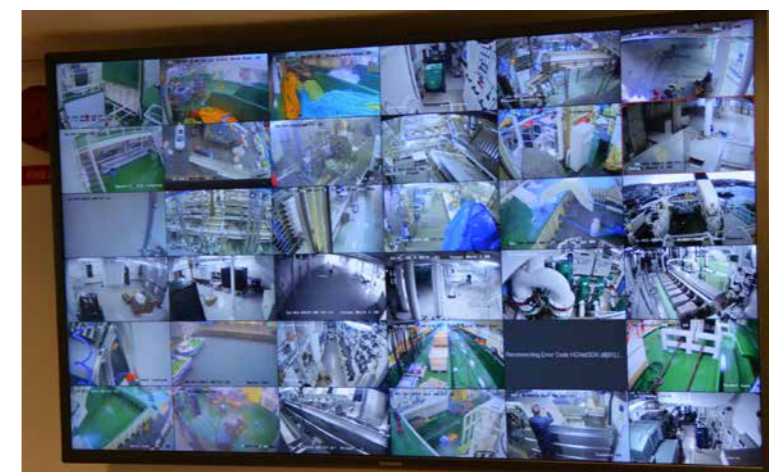
Í kontrollrúminum í maskinrúminum ber til at fylgja við øllum, sum fyriferst á verksmiðjuni. Myndir frá 36 upptøktólum gera, at skjótt er at traðka til, um okkurt brek er.