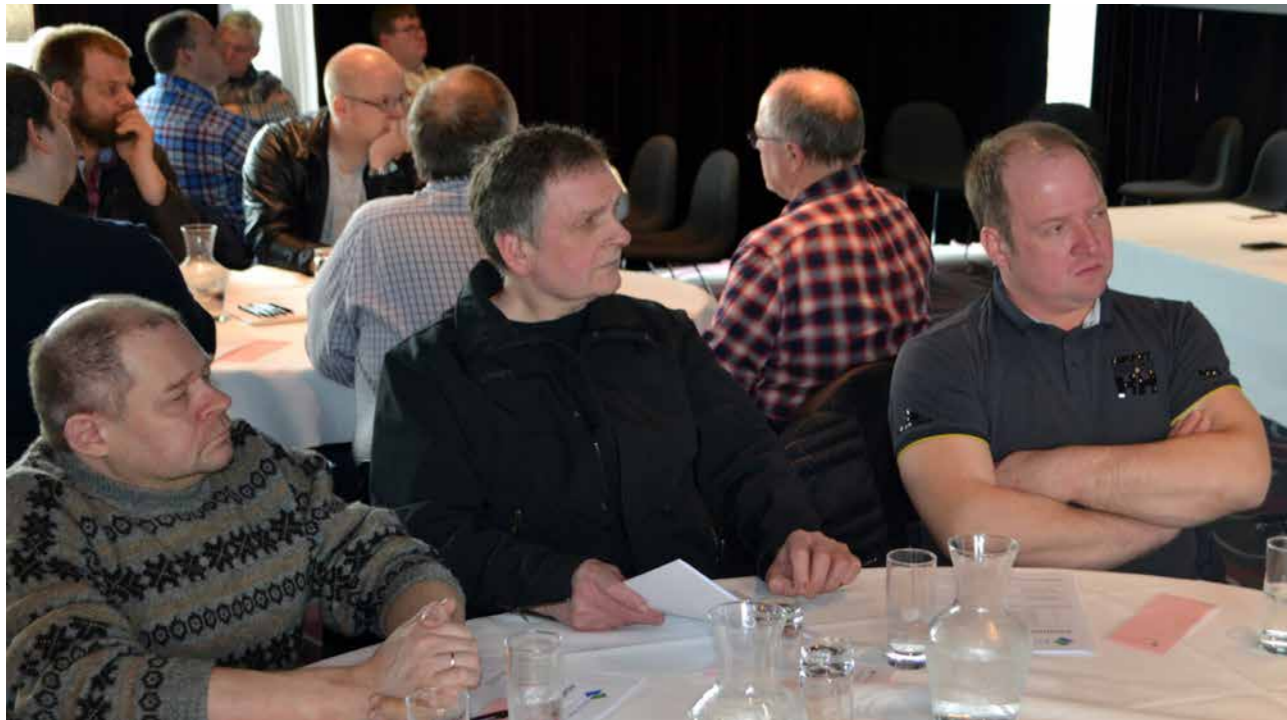
Umleið 50 limir voru møttir á aðalfundi

partarnar, at ilt var at koma víðari uttan hjálp. Avgjørt var tí at fáa Semingsstovnin inn á banan. Grundað á at hesir voru sera upptiknir av øðrum semingum, voru vit settir í bíðirøð. Góðar triggjar vikur seinni sluppu vit endiliga frammat, og eftir eitt semingstørn upp á knappa viku bleiv semja undirskrivað fríggjadagin 1. juni.