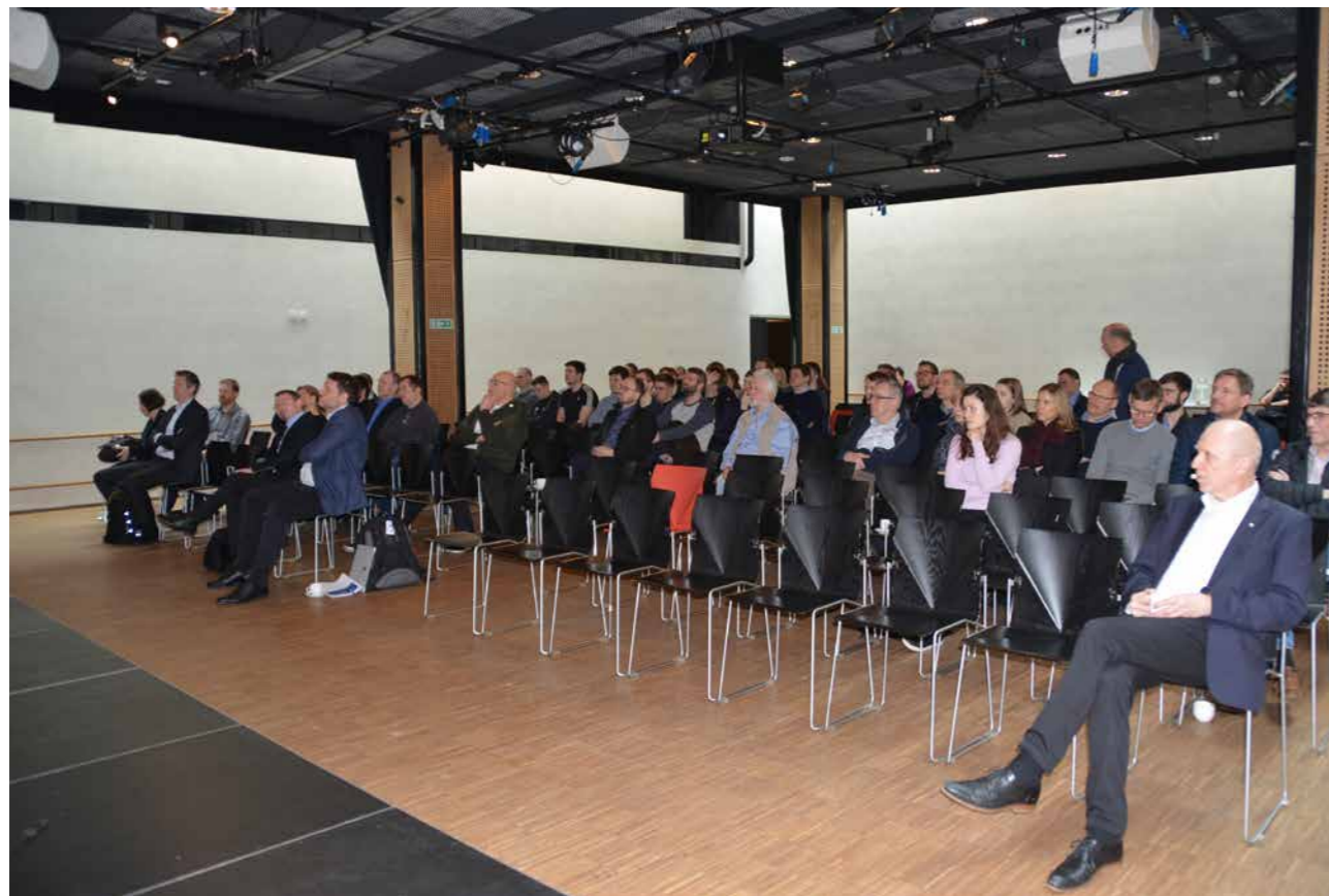
Ráðstevnan var í Skálanum í Norðurlandahúsinum.

grannalondunum. Hesi londini ganga undir sonevndu SECA-krøvini, sum millum annað áseta, at svávlulátið í roykinum frá skipum ikki má fara upp um 0,1 prosent.