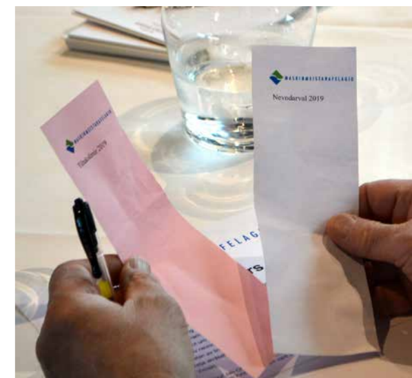
Atkvøðast skuldi um nevndarlimir og tiltakslimir.