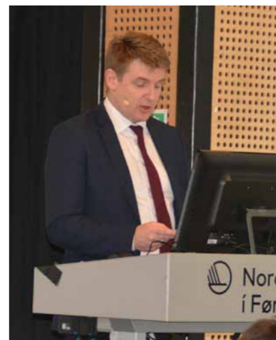
Aksel V. Johannesen, løgmaður, setti ráðstevnuna.

„Føroyar er ein fiskivinnutjóð, ið livir av tí, sum kemur úr havinum, og vit branda okkum við, at vit hava heimsins reinasta hav.