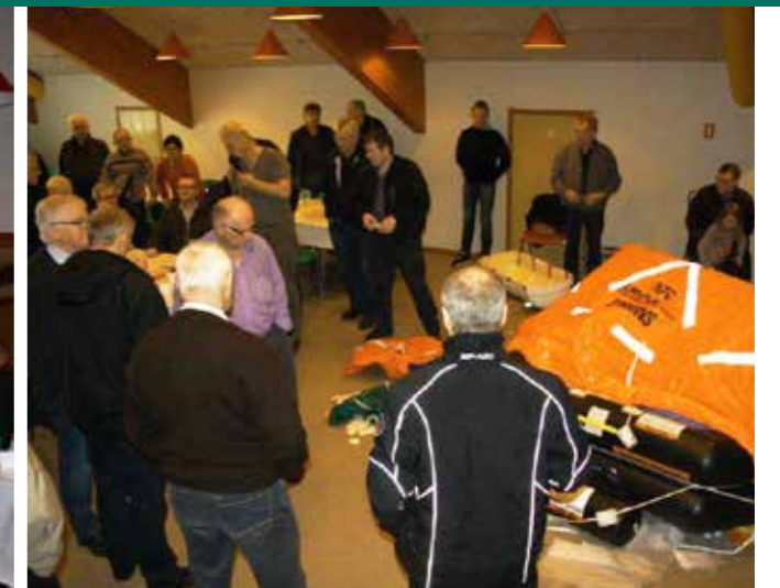
78 fólk møttu til temadag.