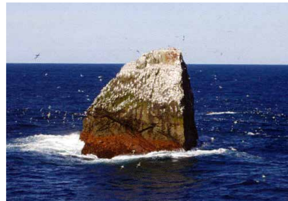
Í 1887 fór fyrsta føroyska skipið, Delfinen, at royna fiskiskap við Rokkin, Rock All.

Hetta saman við miseydnadum fiskiskapi undir Íslandi gjørdi, at seinna helvt av 1880 árunum vóru kreppuár í Føroyum. Serliga illa stóð til í 1887. Veturin 1886-87 hevði verið ringur við seyðasjúkum og stórum seyðafelli. Fiskiskapurin var vánaligur, og summarið royndist illa. Støðan bara versnaði, og ótti var fyri hungursneyð. Sjálvt kongsbøndur vóru í neyð, fleiri teirra megnaðu ikki at gjalda jarðarleigu og kommunuskatt.