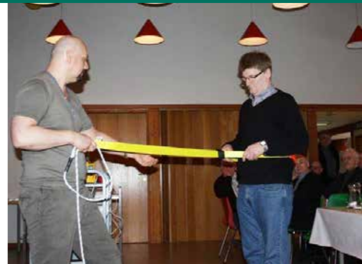
Bjargingarglúpurin verður royndur.

– Tað er eitt rák í tíðini, at fleiri og fleiri fólk fáa sær bát ella kampingvogn. Tey brúka meira tíð enn áður at ferðast í eignum landi, og tað