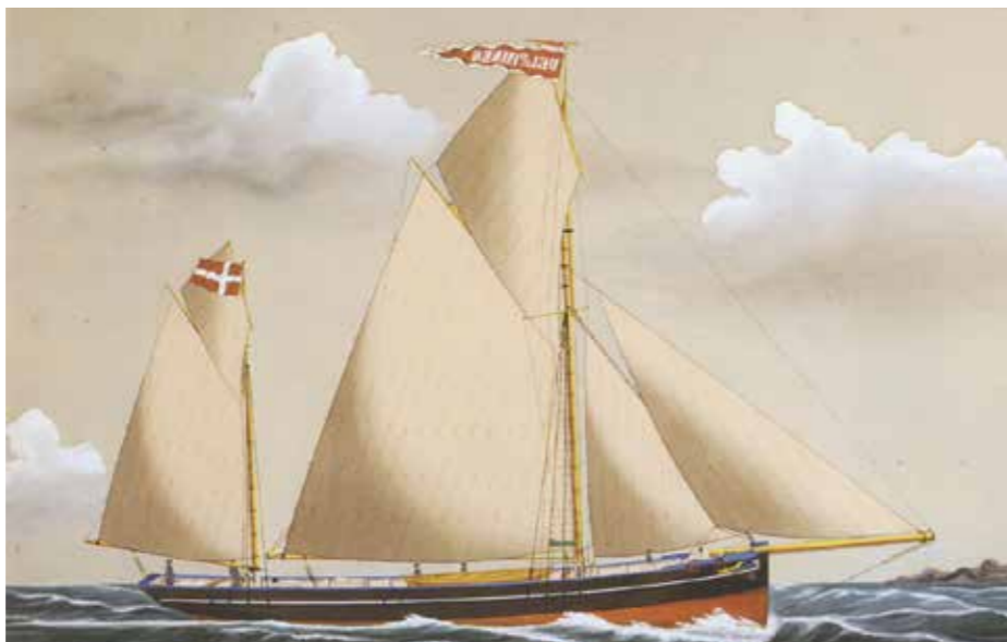
Delfinen var ein av fyrstu havgangandi nýbygningunum, sum føroyingar lótu byggja.

Men tað vóru ikki allir íslendingar, sum tóku væl ímóti føroyingum. Í brævi, sum sent varð Altinginum, undirskrivað 12. mars 1875, verður m.a. sagt frá uppruninum til føroyska fiskiskapin undir Íslandi. Í hesum brævi verður greitt frá, at føroyskt skip var stutt á Seyðisfirði heystið 1871. Føroyingar høvdu um summarið ród út frá hesum skipi á tey vanligu miðini, sum seyðfirðingar eru vanir at royna á. Árið eftir, 1872, komu tvey fiskiskip úr Føroyum, væl útgjørd á allan hátt, bæði við manning og fiskireiðskapi. Tey lögdu seg í legu við Hánefsstaðeyri. Um heystið fóru skipini heim við stórari veiði uttan at hava