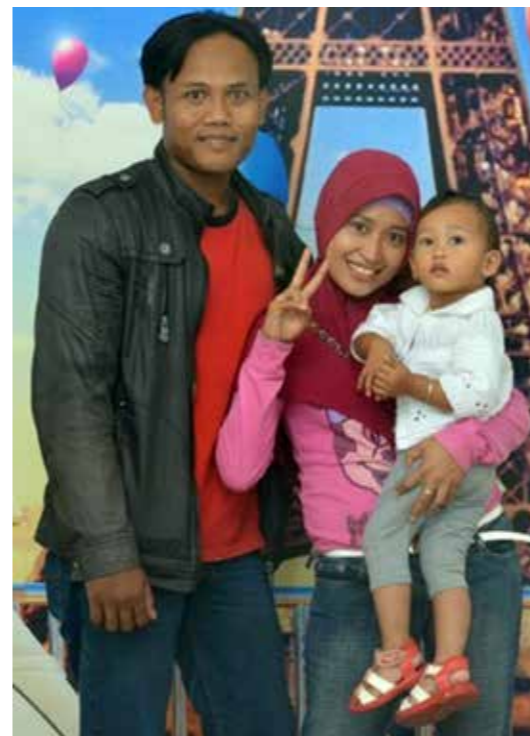
Tey trý: Saefundin, konan og dótturin.

Maður mín hevði ábyrgd fyrri síni familju, eg vil minnast hann við stoltleika, soleiðis endar hon sína frágreiðing.