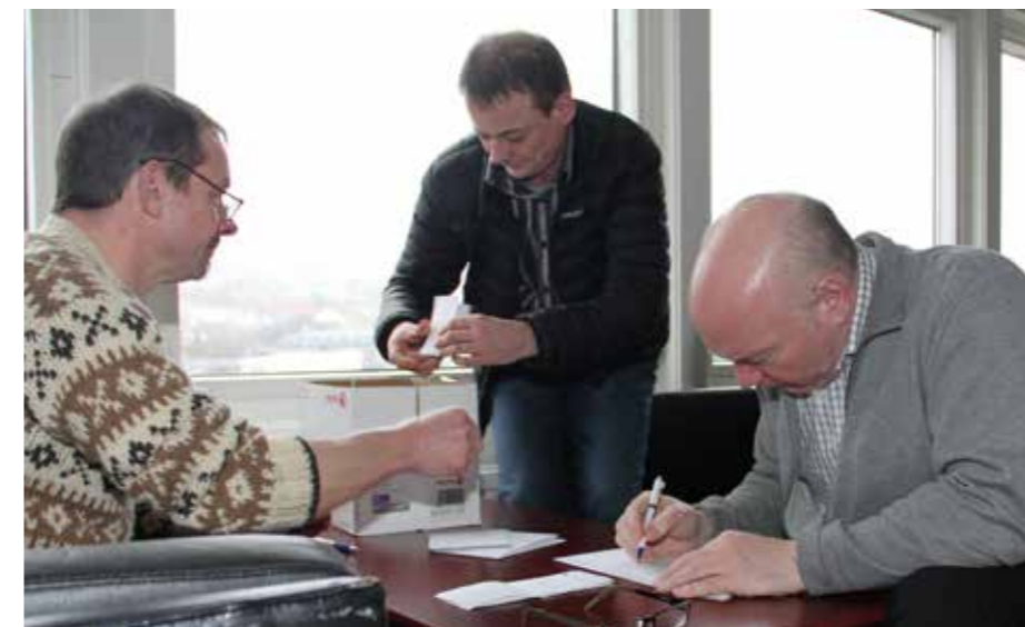
Atkvøðuseðlar verða taldir.

Síðsta heyst var NMF fundur í Reykjavík, hettar var kongress, t. v. s. at presidentur skuldi veljast. Maskinmeistarafelagið stóð fyri tærni til hendan postin, og tóku vit við uppgávu.