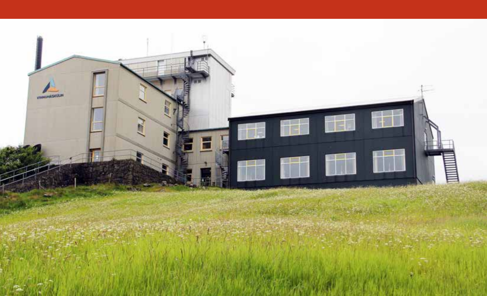
Komandi skúlaár byrja 120 næmingar á skúlanum, tað er met.

Petersen, sum sjálvur kennir akademiska umhvørvið væl. – Tað er týðningarmikið at hjúkla um tey framfýsnu, tey við ambítiónunum, tí tað er frammi í oddinum, at støðið verður lagt. Krøvini til hesar næmingarnar eru strong, og ongar neyðloysnir verða góðtiknar. Tað má ikki henda, at vit missa næmingar til skúlar uttanlands, tí fakliga avbjóðingin her er ov lítil, sigur hann.