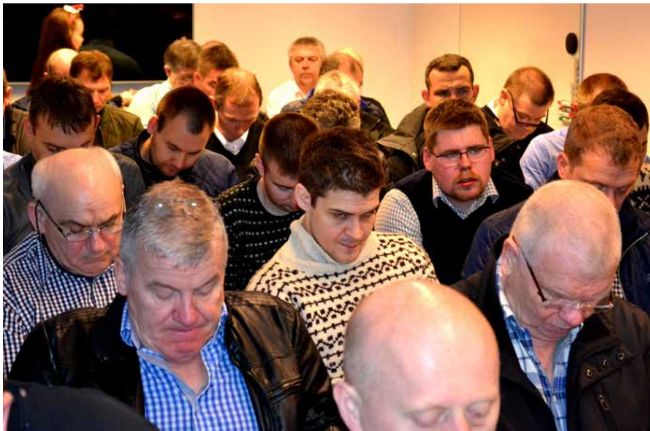
Millum 50 og 60 mans vóru møttir á aðalfundinum.

Sáttmálin millum Føroya Skipara- og Navigatørfelag og Lønardeildina viðvíkjandi Magnus Heinasyni er eis-