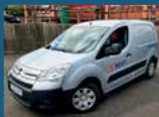
Vit koyra kring alt landið