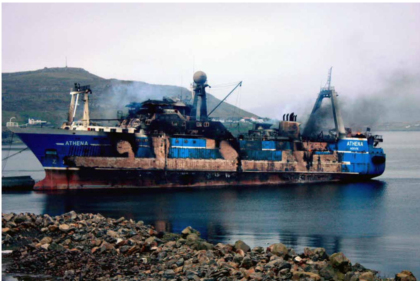
Athena hjá Thor í Hósvík var eitt av skipunum, sum fiskaði rossamakrel í Kyrrahavinum, men tá skipið brann, lá fiskiloyvi eftir og endaði, sum makrelloyvi undir Føroyum.