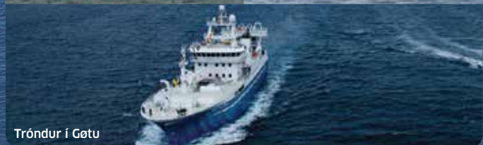
Tróndur í Gøtu