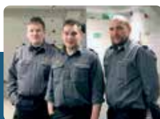
Lætt at bíleggja umvegis telefon ella teldupost