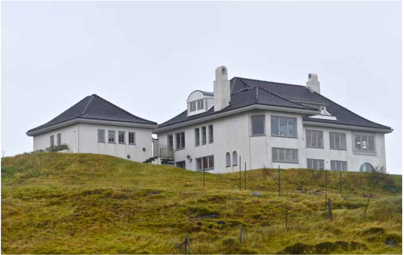
Norðurlenska Navigatørkongressin í Føroyum verður hildin í nýggju húsunum hjá felagnum.