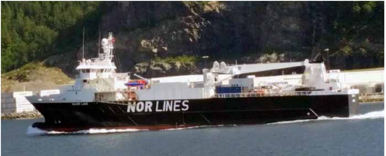
Silver Lake.

nýggjum manningarskjølum til Silver Lake og Silver River, og hesaferð vóru skjølini í samsvari við STCW-krøvini.