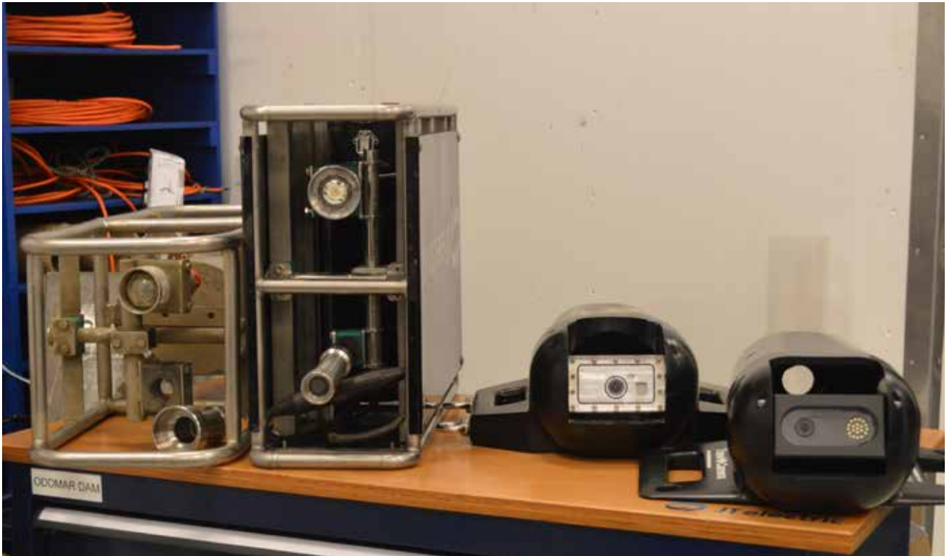
Trolmyndatól úr vinstu: 2006, 2008 og 2010. Í tí seinasta er tað serliga innmaturin, sum er broyttur, tí nú ber til at samskifta við myndatólið, meðan trolað verður.

undir fiskin, og so sært tú á einum skermi, um fiskurin er mettur.