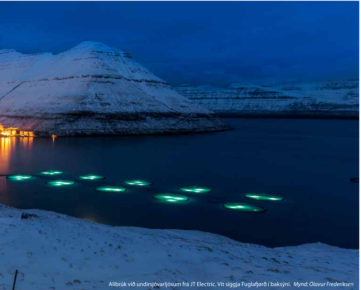
Alibrúk við undirsjóvarljósum frá JT Electric. Vit síggja Fuglafjørð í baksýni.

fyrir sildaverksmiðjuna Havsbrún og fyrir mongu skipini, ið komu til Fuglafjarðar, eisini aðrar uppgávur, eitt nú gøtuljósini í Fuglafirði, innlegging í sethús, Ísvirkið úti á Land, flakavirki og so framvegis.