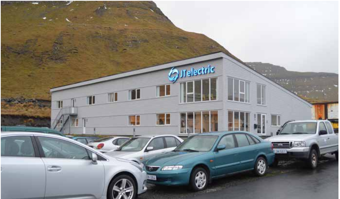
JT Electric liggur væl fyrri í nýggjum og góðum hølum á Kambsdali.

samstarvaði JT Electric við Oilwind í Vágum. Ætlanin var alla tíðina, at hendan ætlanina skuldu gerast “undirsjóvarljósið” hjá JT-Electric.