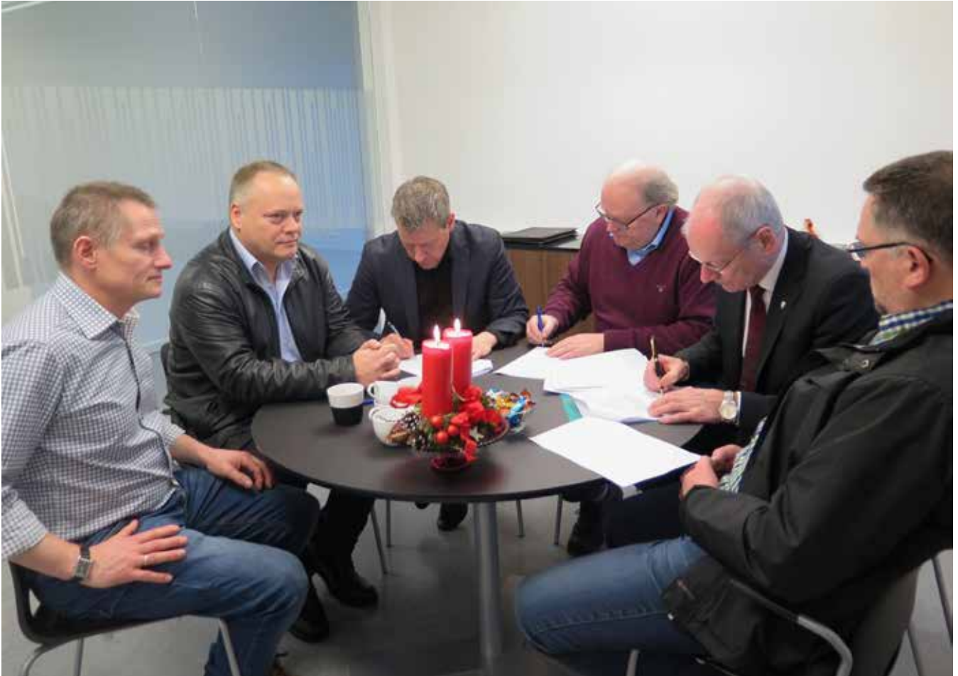
16. desember skrifuðu Maskinmeistarafelagið og KAF undir nýggja tvey ára semju.

Nýggja semjan mill- um KAF og Maskin- meistarafelagi inni- ber, at lønin hækkaði 1,03 prosent við aftur- virkandi megi frá 1. oktober 2015, og 1. oktober í ár hækkar hon aftur 1,9 prosent.