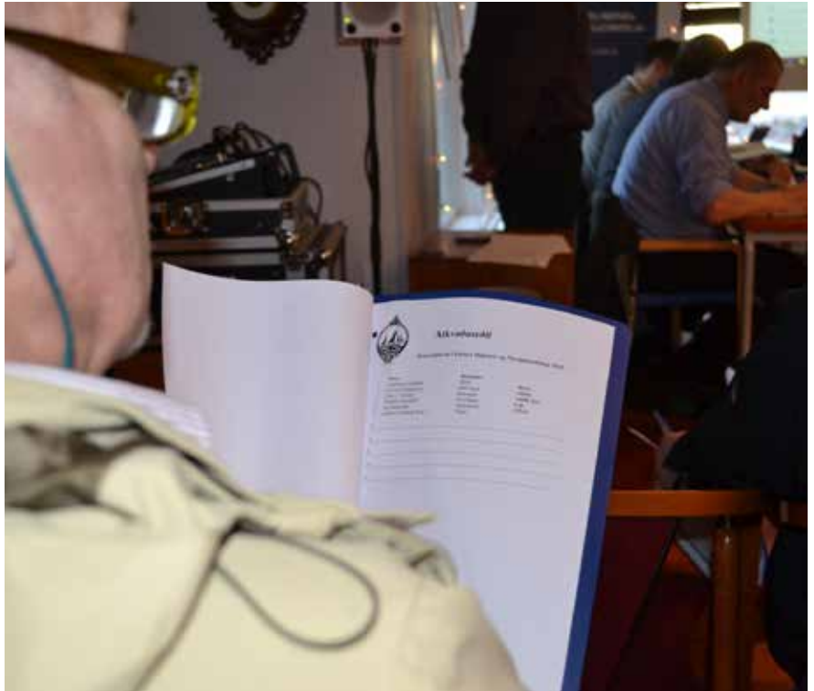
Helvtin av nevndarlimunum stóð fyri vali.

Føroya Skipara- og Navigatørfelag arbeiðir við at fáa sáttmálar fyri navigatørar, sum starvast á landi, har kravið til starvið er hægsta nautiska útbúgving. Sum dømi kann nevast sýnsmenn hjá Sjóvinnustýrinum, DPA, HSEQ og persónar hjá almennum stovnum (SSL) og hjá Føroyskum reiðaríum. Føroya Skipara- og Navigatørfelag metir, at tað er av størsta týðningi, at vit fáa hesi viðurskipti í rættlag, og hetta er eitt ynski frá navigatørunum eisini.