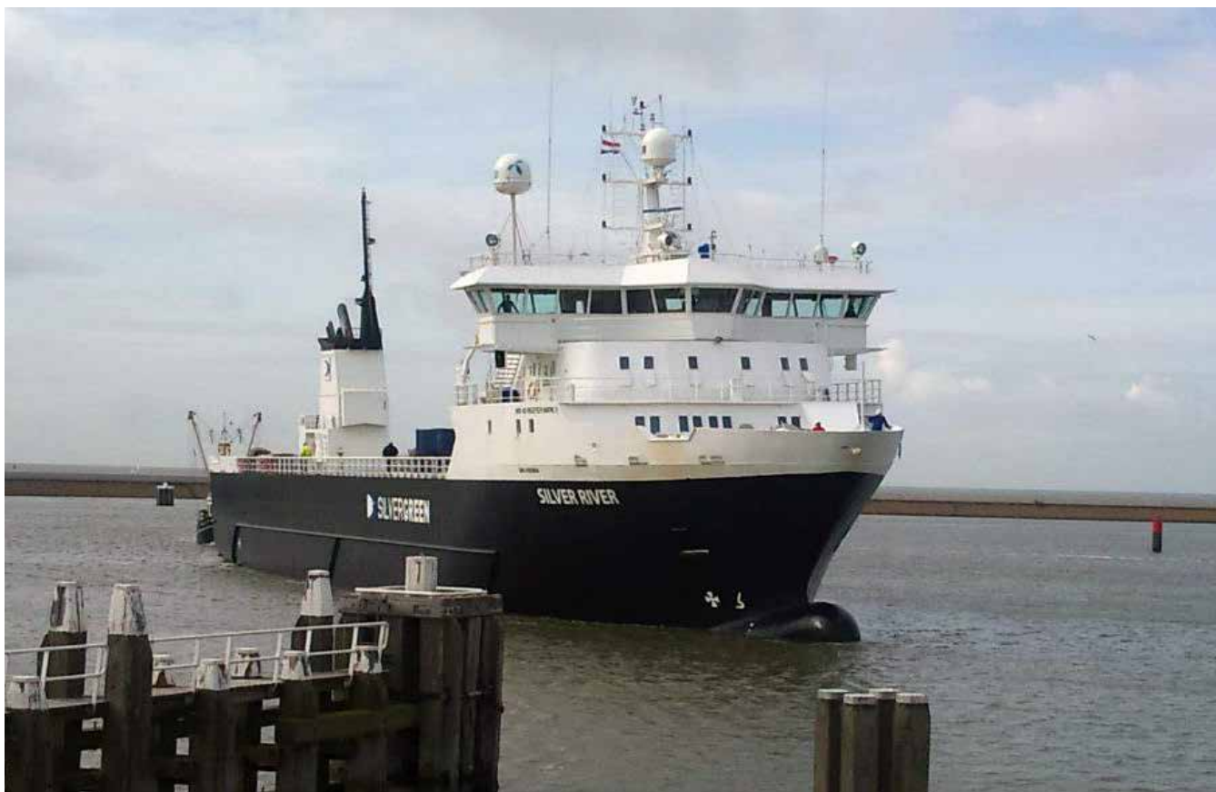
Silver River. Mynd: Facebook-vangin hjá Fjord Shipping Management.