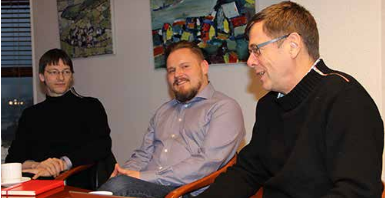
Fundur við VMR - Vodafone.

Kl. 9.30: Stýrisfundur í Trygdargrunninum. Kl. 13.00: Fundur í Frunnum fyri óarbeiðsførar fiskimenn, viðgerð av umsóknum um stuðul.