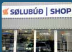
Sølubúð/goymsla í Havn, Runavík og á Skála