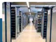
Størsta og besta goymsla í landinum