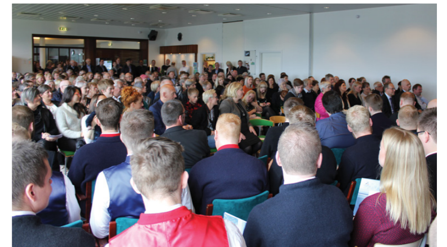
Tilsamans 43 maskinmeistarar, skipsfórarar og skiparar fingur prógv hesaferð, so Skálin á Vinnuháskúlanum var stúgvandi fullur.

- Felagið er til fyri tykkum, so smæðist ikki við at brúka tað, segði hann.