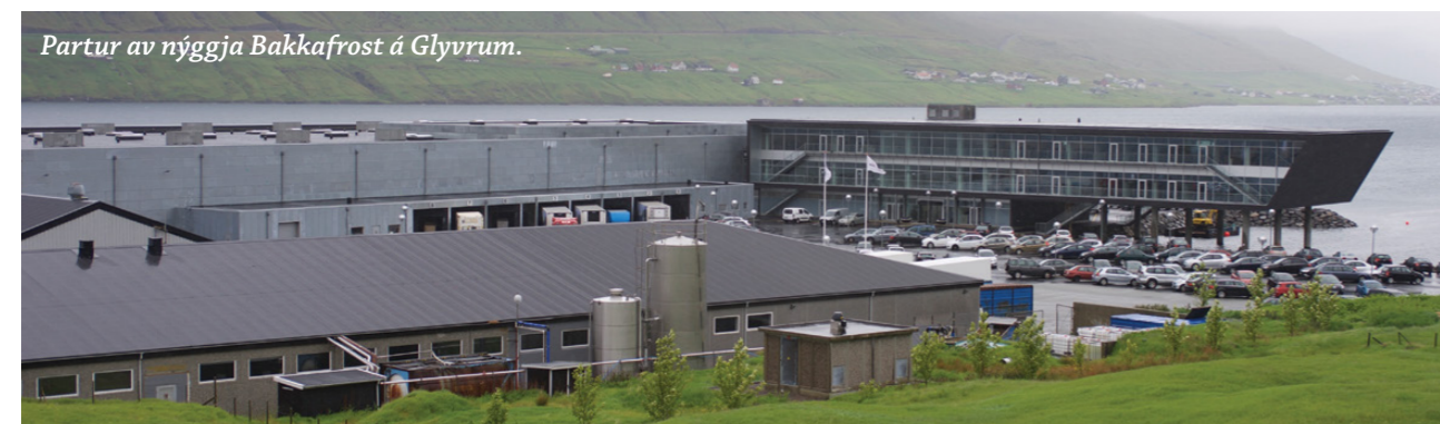
Partur av nýggja Bakkafrost á Glyvrum.

- Eg vil siga, at tað týðningarmesta og tann størsta avbjóðingini er júst at hava alt