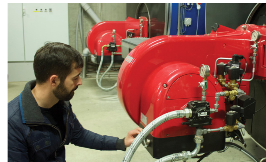
Maskinurnar og tólini á virkinum eru mong at hava eftirlit við.

síggi eg, hvussu stórt hetta nýggja virkið á Bakka er, hesaferð úr einum heilt øðrum sjónarhorni.