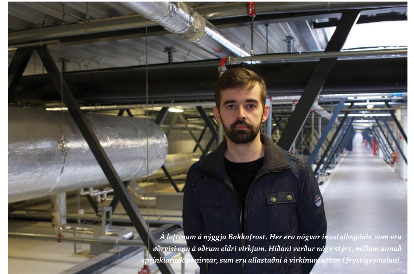
Á loftinum á nýggja Bakkafrost. Her eru nógv innstallasjónir, sum eru øðrvísi enn á øðrum eldri verkjum. Hiðani verður nógv stýrt, millum annað sprinklaraskipanirnar, sum eru allastaðni á virkinum uttan í frystigoysluni.

Eftir at hava sæð verksmiðjuna, vísir tekniski stjórn