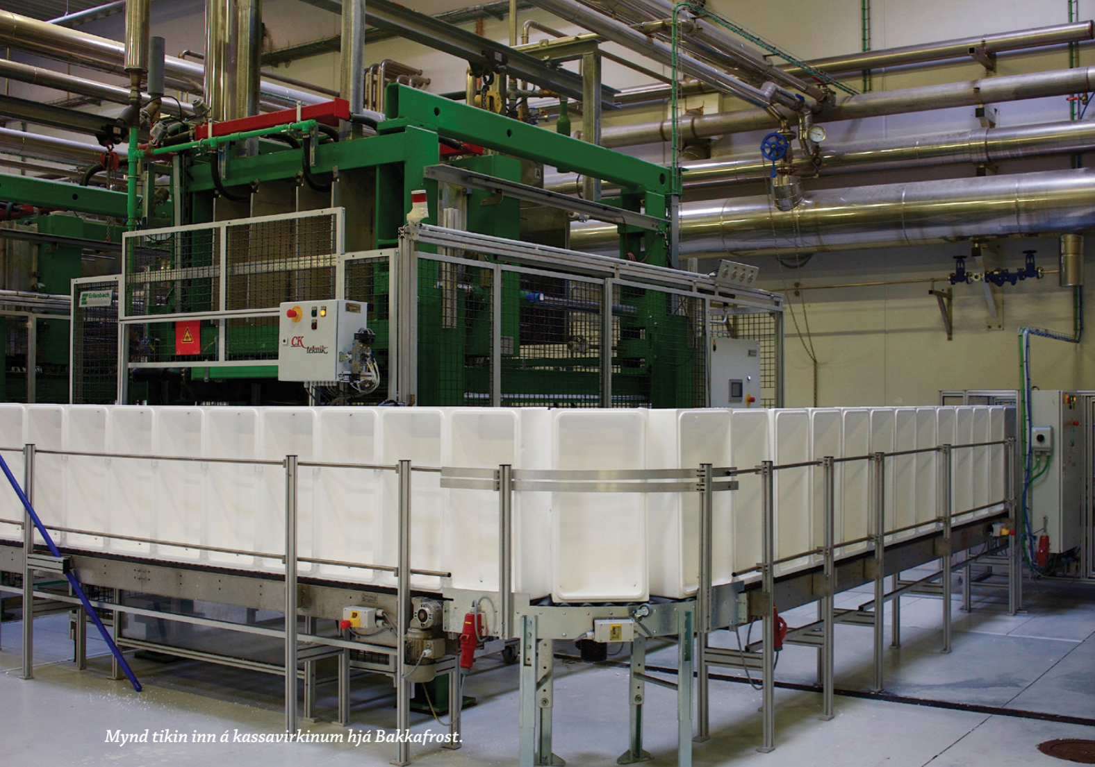
Mynd tikin inn á kassavirkinum hjá Bakkafrost.

koyrandi alla tíðina. Her arbeiða eini tveyhundrað fólk og steðgar ein linja, so standa nógv fólk og bíða. Í flakahöllini til dæmis arbeiða 150 fólk, so tað ávirkar nógv, um ein linja gerst óvirkin, sigur hann.