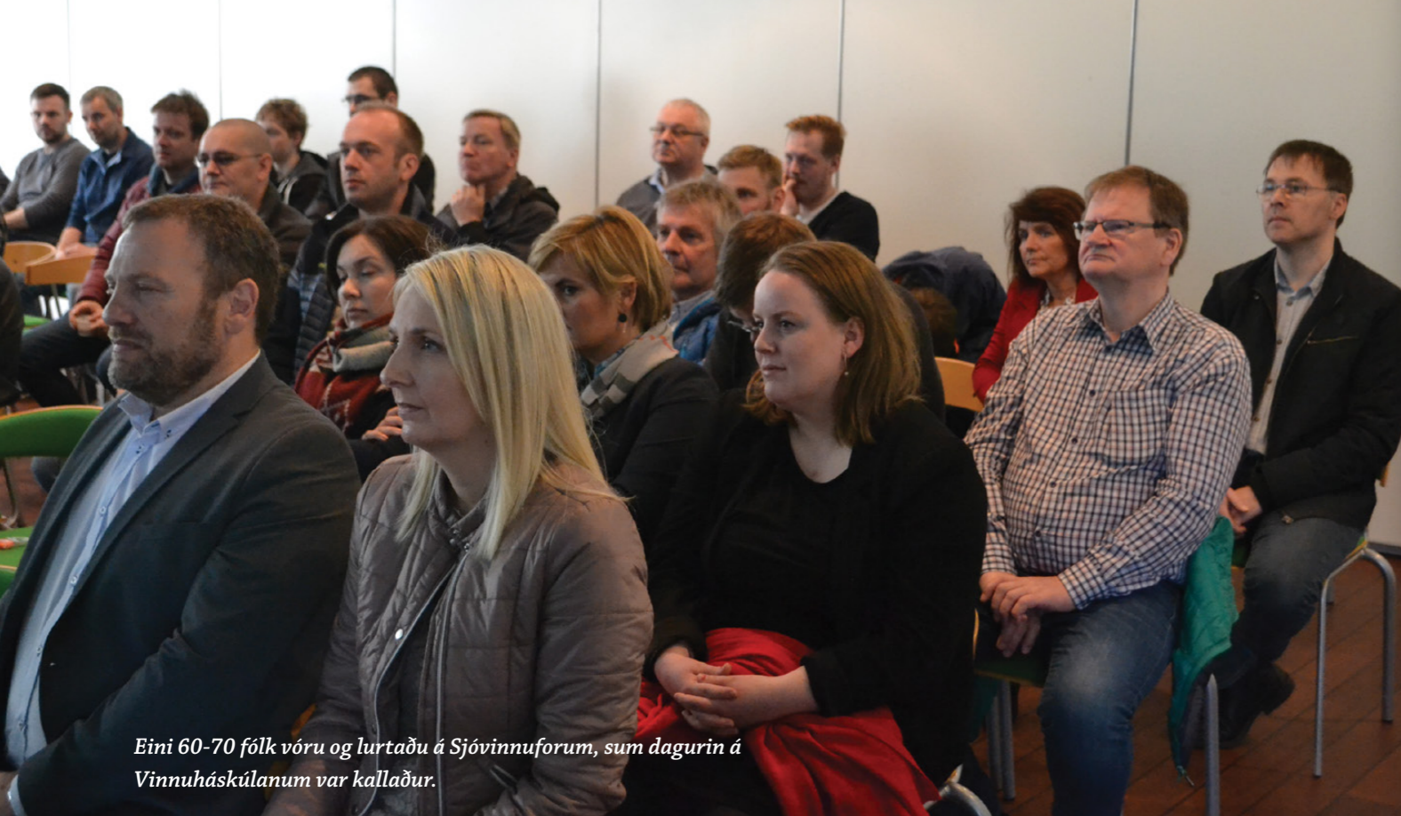
Eini 60-70 fólk voru og lurtu á Sjóvinnuforum, sum dagurin á Vinnuháskúlanum var kallaður.

ódugnaligur, og verður mista inntøkan á ein ella annan hátt smurd av upp á hann, ella í hvussu so er sleppur hann at hoyra fyri hettar.