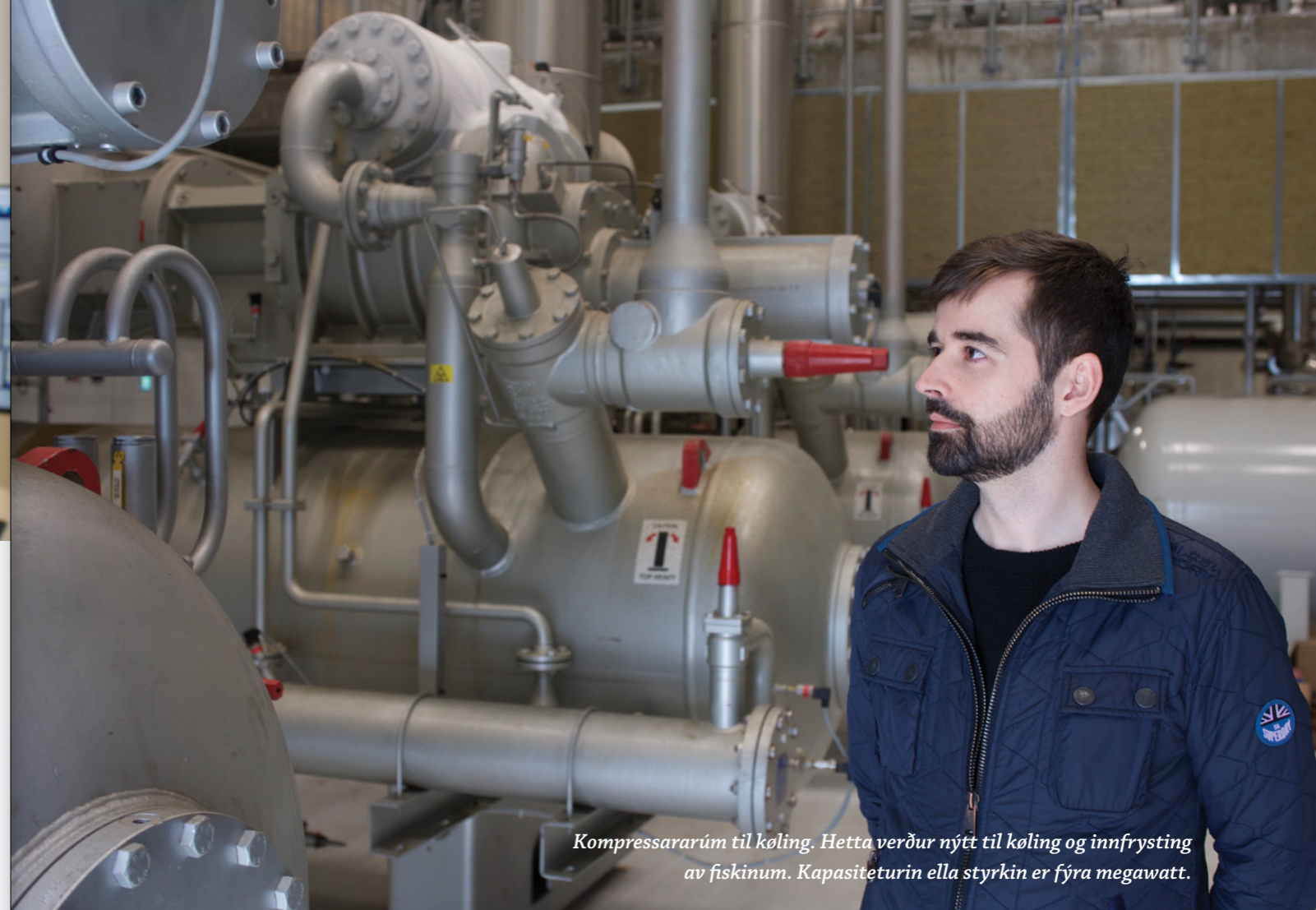
Kompressararúm til køling. Hetta verður nýtt til køling og innfrysting av fiskinum. Kapasiteturin ella styrkin er fyra megawatt.

Á einum virki sum Bakkavirkinum er neyðugt við stórum og góðum skipanum á nógvum økjum, og tað hava tey eisini á Bakka. Til dømis er køliskipanin stór –